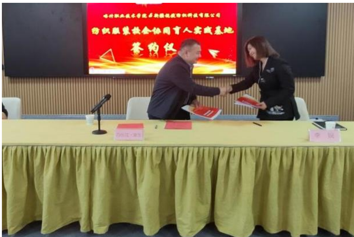
图 48：校企双方签约仪式