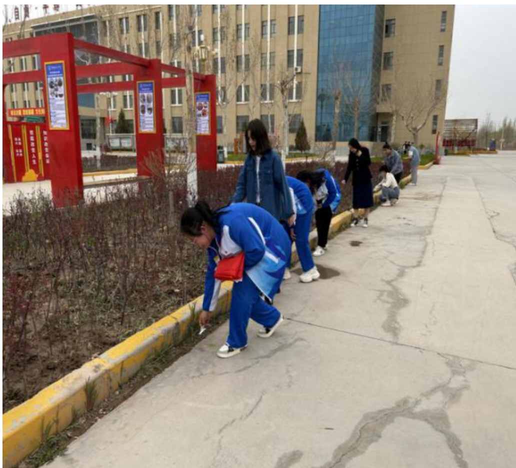
图 6：师生学雷锋美化校园

洁环境。其间，遇见了许多学生与老师们，大家相互交流并传播环保理念，宣传志愿服务精神，得到了其他老师同学的一致好评。