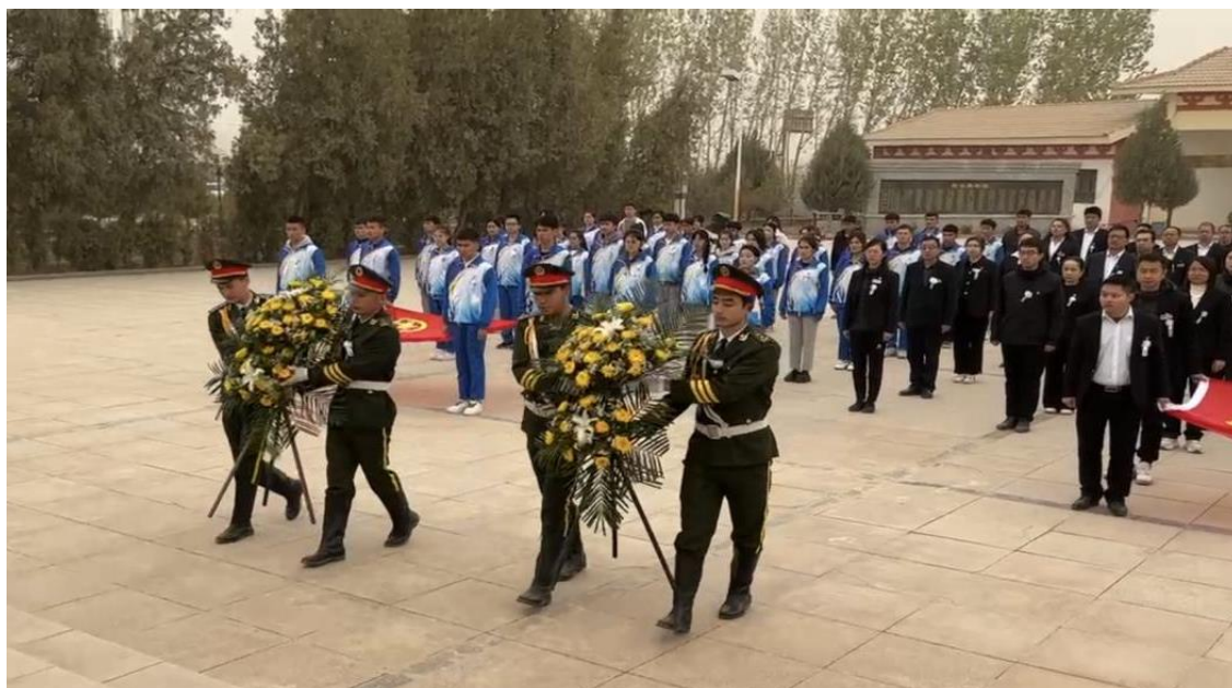
图 55：师生为烈士献花篮

为深入学习贯彻落实党的二十大精神，凝聚精神力量，激发师生们的爱国主义情感，更好地发挥党员、团员的模范带头作用，做好党建带团建工作奠定了坚实的基础。