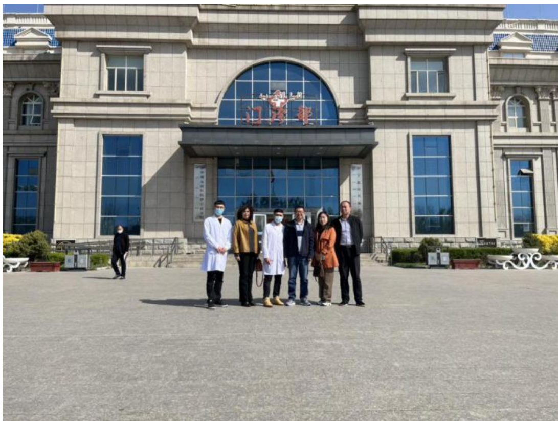
图 7：访企拓岗进行时

本次调研走访，完成首次与北疆多家在实习就业等方面的调研走访，对喀什水利水电学校在北疆的招生、实习和就业工作的开展具有里程碑意义。