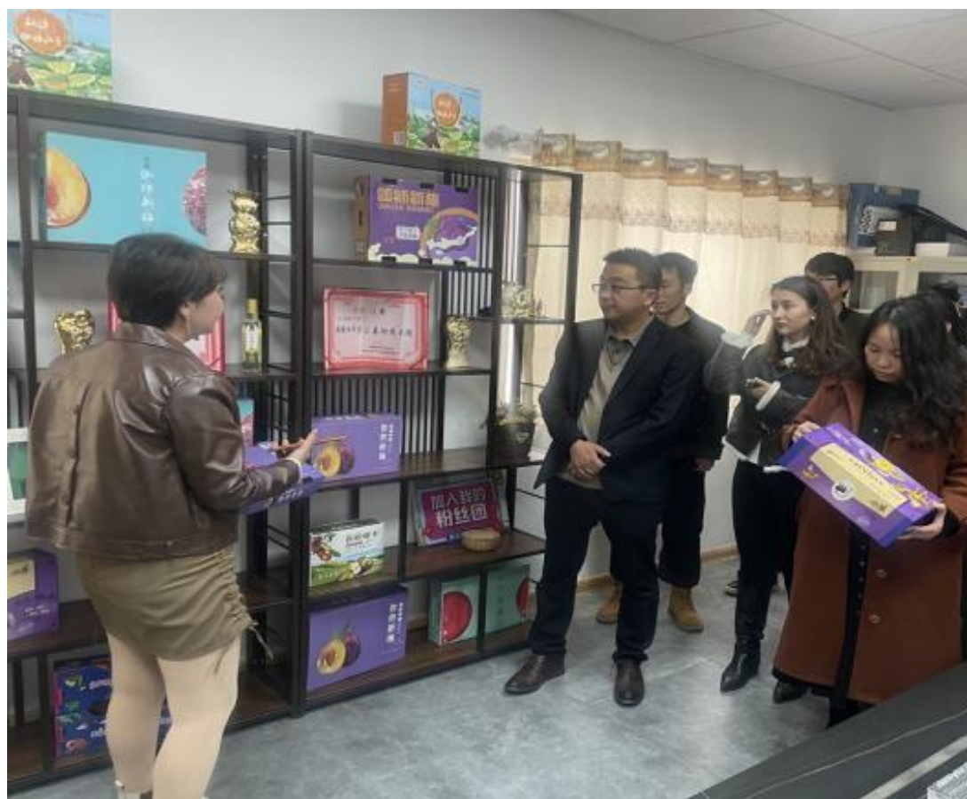
图 50：教师参观特色农产品电商平台

平台，拓宽毕业生在喀什就业基地的范围，也为提高学生的就业质量，服务于地方经济发展创造了条件，对学校电子商务专业教学改革、就业工作的发展起到积极地推动作用。