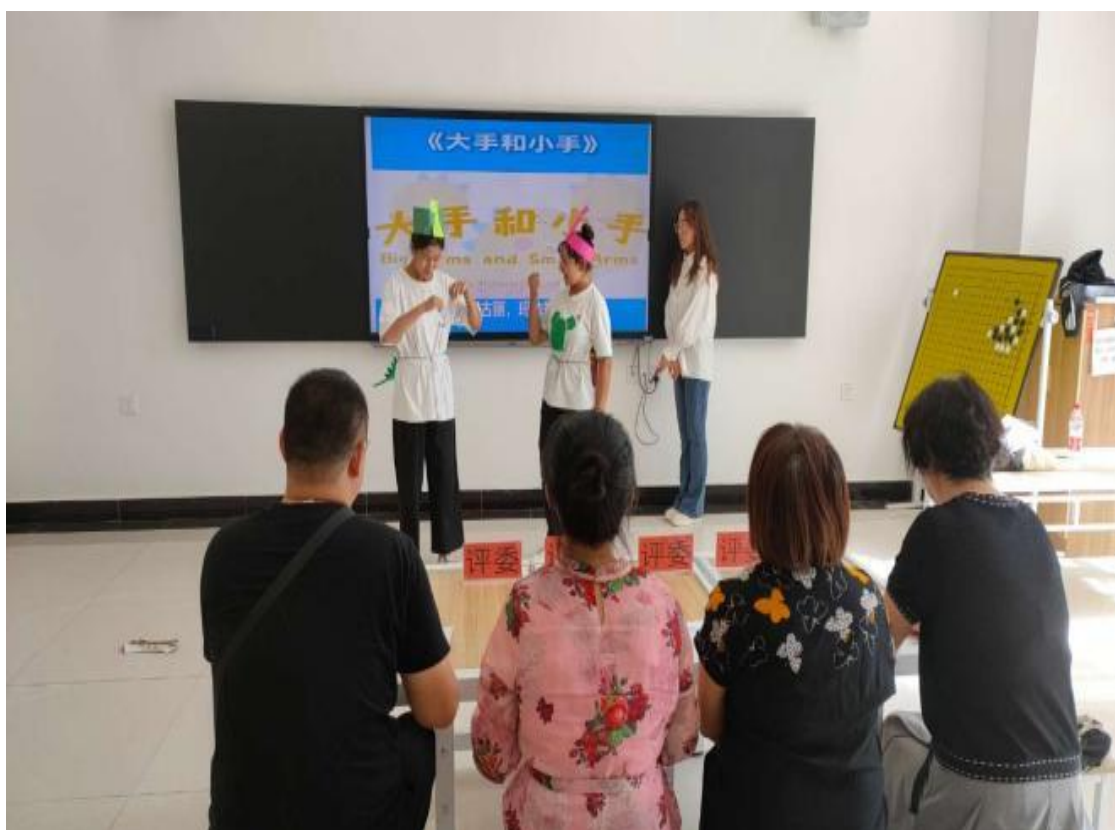
图 41：“小手拉大手”讲故事大赛现场