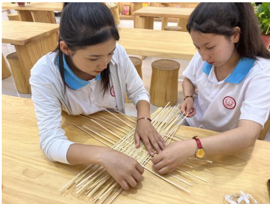
图31：学生在制作竹编扇