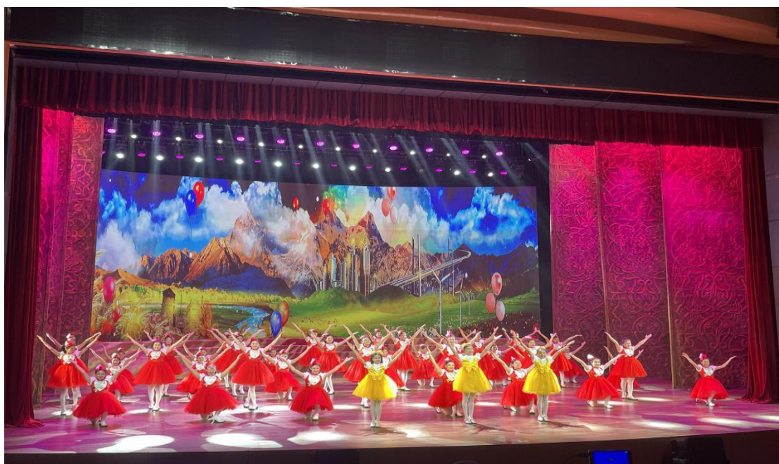
图 24：《向快乐出发》展演