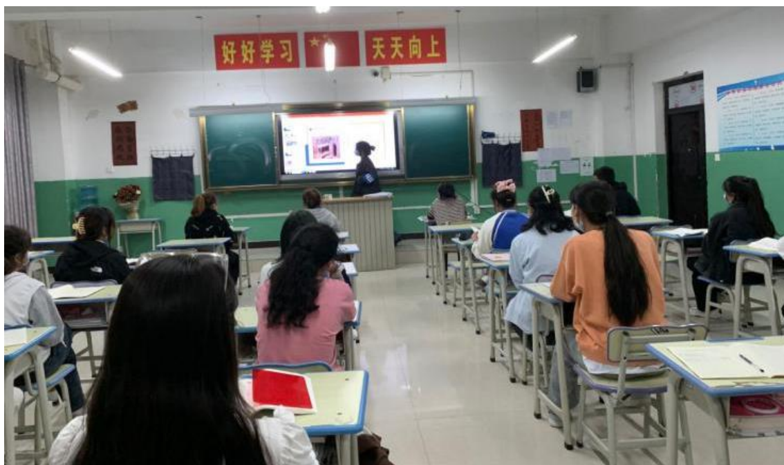
图 5：学雷锋宣讲团开展宣讲