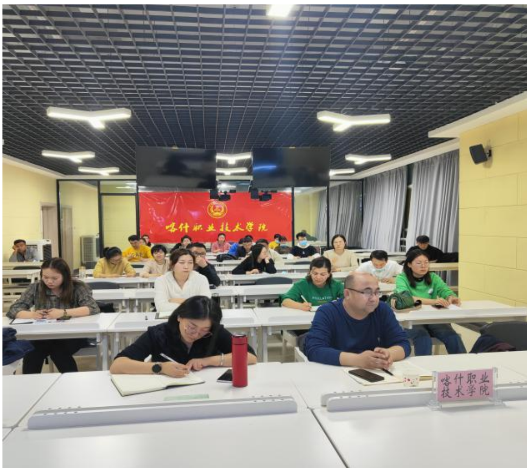
图 10：参加教育部全国高校毕业生就业工作第二次调度会议