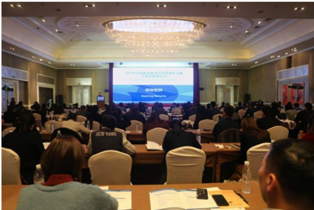
图 58：沪喀职业教育联盟年会