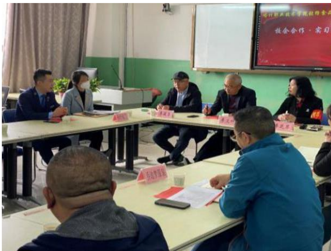
图 4：校企深度合作、实习就业研讨会

研讨会中，系部表示要紧密结合地区产业发展推进校企深度融合；同时深入了解企业人才需求，做好实习就业服务。