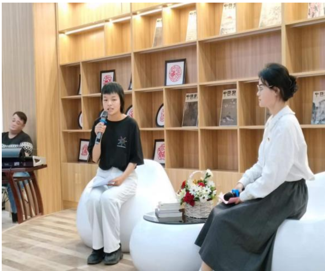
图 25：师生共享读书之乐

第三届“四月读书会”，师生因共同的爱好——读书，走到一起，徜徉于书的海洋，在喧嚣的尘世尽享一隅的静谧，用诗书浸润心灵，让书香溢满校园。