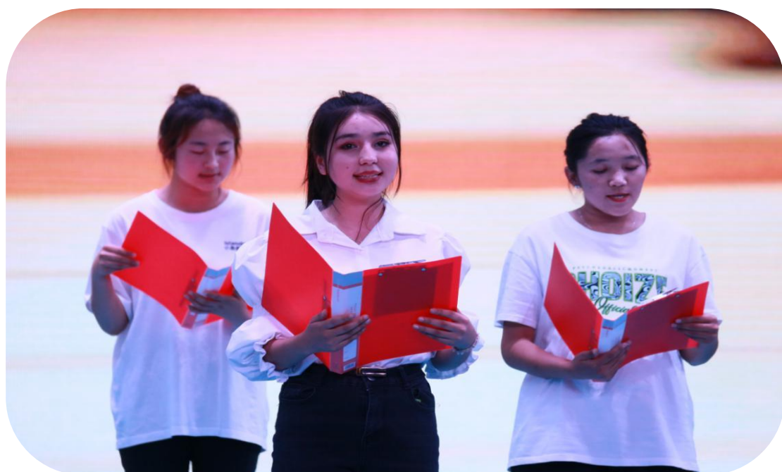
图 38：学生朗诵《诗意中国》

此次活动检验了学生学习国家通用语言的成效，展现了同学们感恩祖国、积极向上的精神面貌，进一步提高了同学们的语言文字规范意识，为传承弘扬中华优秀传统文化奠定坚实基础。