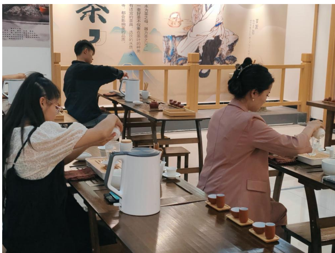
图 36：学生在“国学苑”体验茶艺

本次参观校园文化阵地系列活动，让大家感受到校园文化浓厚的氛围与魅力，让我们周围的校园环境“活起来”，真正发挥校园文化阵地建设的教育意义。