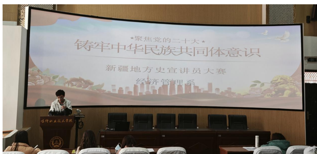
图 37：学生讲述阿尼帕·阿力马洪故事

此次宣讲员大赛，一个个鲜活的事例被搬上舞台，让我们更加深切地认识了新疆，更加深入地了解新疆的历史。