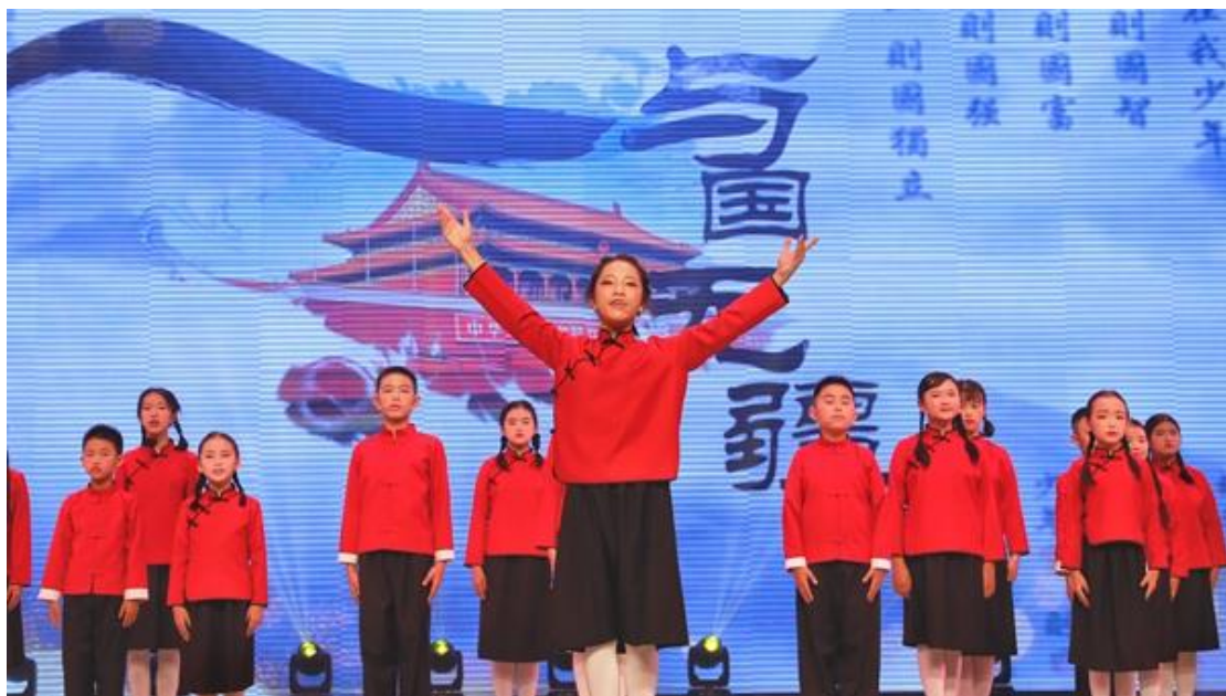
图 40：“家园中国”诵读大赛现场

9月12日下午，诵读大赛现场的参赛选手紧紧围绕活动主题，以独诵、合诵、情境朗诵等形式，通过《中国颂》《月光下的中国》《如果信仰有颜色》《读中国》《少年中国说》等主题鲜明的作品，诵出了我们伟大的中国共产党浴血奋战、领导人民开拓进取的华歌；诵出了我们对伟大祖国日新月异、蒸蒸日上的赞美；诵出了我们青年当自强、吾辈创佳绩的豪情！赛场上，选手们声情并茂、激情澎湃，以饱满的热情歌颂着我们的祖国，抒发着对党深深的热爱，让师生们受到了精神上的洗礼和思想上的升华。