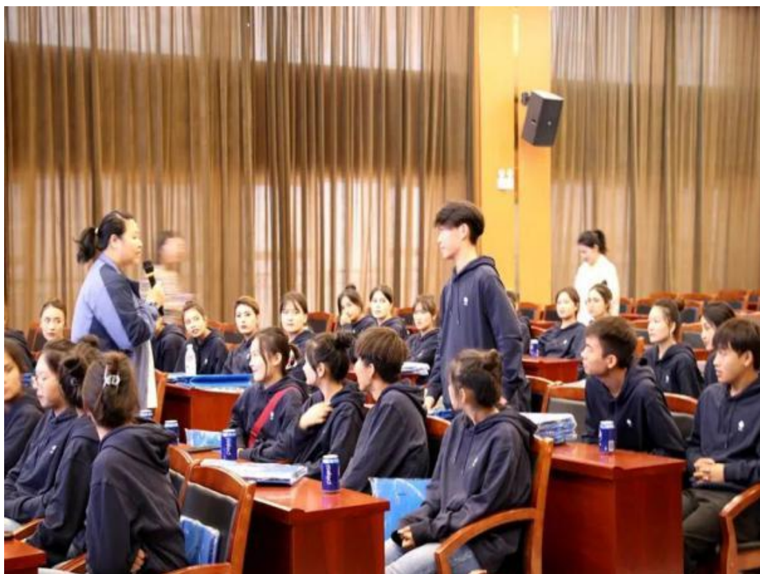
图 57：华住英才班培训