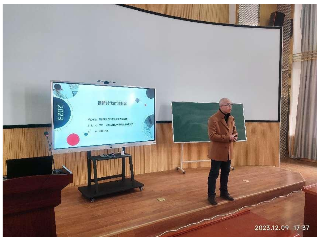
图 11：创业导师举办讲座

学校邀请企业家、创业导师进校园，分享创业经验和心得，融入创业元素，培养学生的创新思维和创业精神，培养学生的独立思考、问题分析和解决问题的能力，引导学生掌握创新创业的基本知识和技能，激发学生的创业梦想，让学生了解创业的重要性，培养他们的创业意识，培养具备创新创业能力的专门人才。