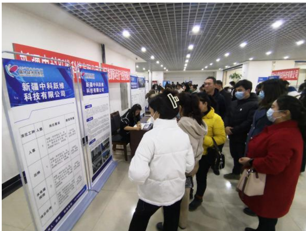
图 9：学生与用人单位进行求职交流