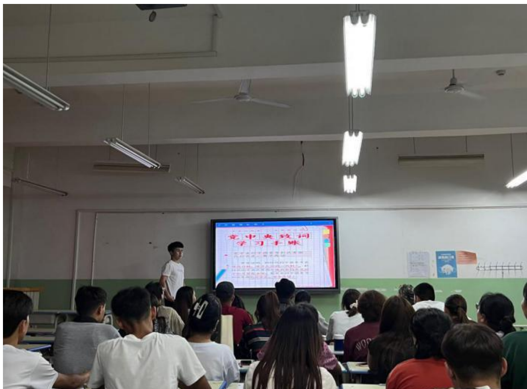
图 52：同学们热议团十九大精神