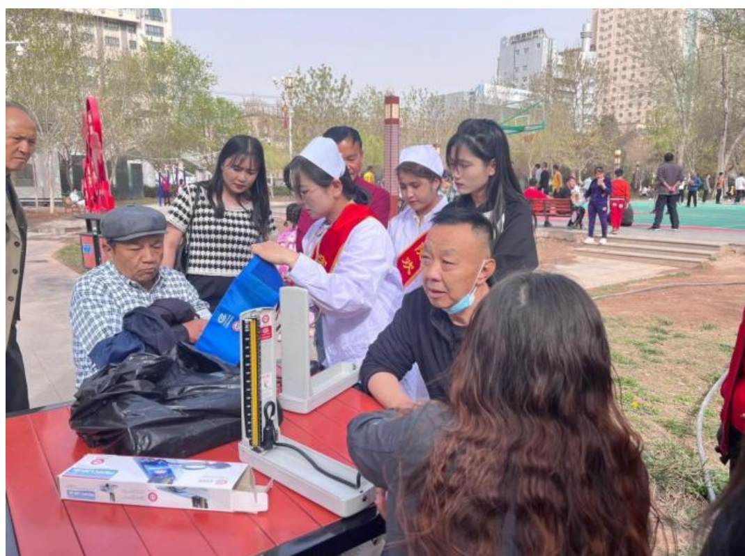
图 19：师生为社区群众义诊

学校深化志愿者文化建设，通过开发志愿服务慕课，培育专业化志愿服务团队，开发志愿服务基地，搭建志愿服务能力提升平台，推动志愿服务转型升级。