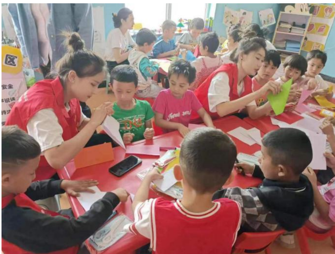
图 20：与幼儿园小朋友进行折纸活动

我校师生与幼儿园小朋友进行了亲切交流，为幼儿园小朋友准备了跳绳、棒棒糖、小背包和折纸等礼物，学生利用所学专业知识和幼儿园小朋友开展幼儿折纸、小蜜蜂儿歌展示、黑走马舞蹈展示等互动活动，优美的旋律、和谐的节奏、真挚的情感给小朋友们以美的享受和情感熏陶，启迪引发他们的思维，又可以增强课堂教学的丰富性，做到快乐学习。