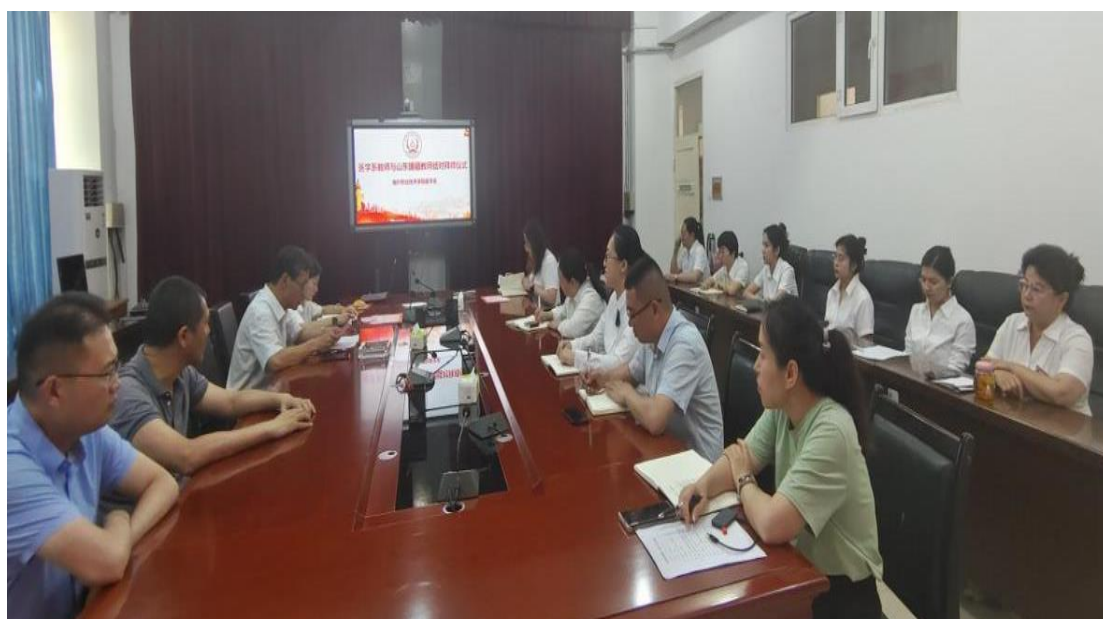
图 59：师徒结对联谊会

这次师徒结对活动的成功举行，将有效促进青年教师的快速成长，进一步壮大学校优秀骨干教师队伍，提升教师队伍的整体素质，为喀什水利水电学校的长远发展奠定坚实的基础。