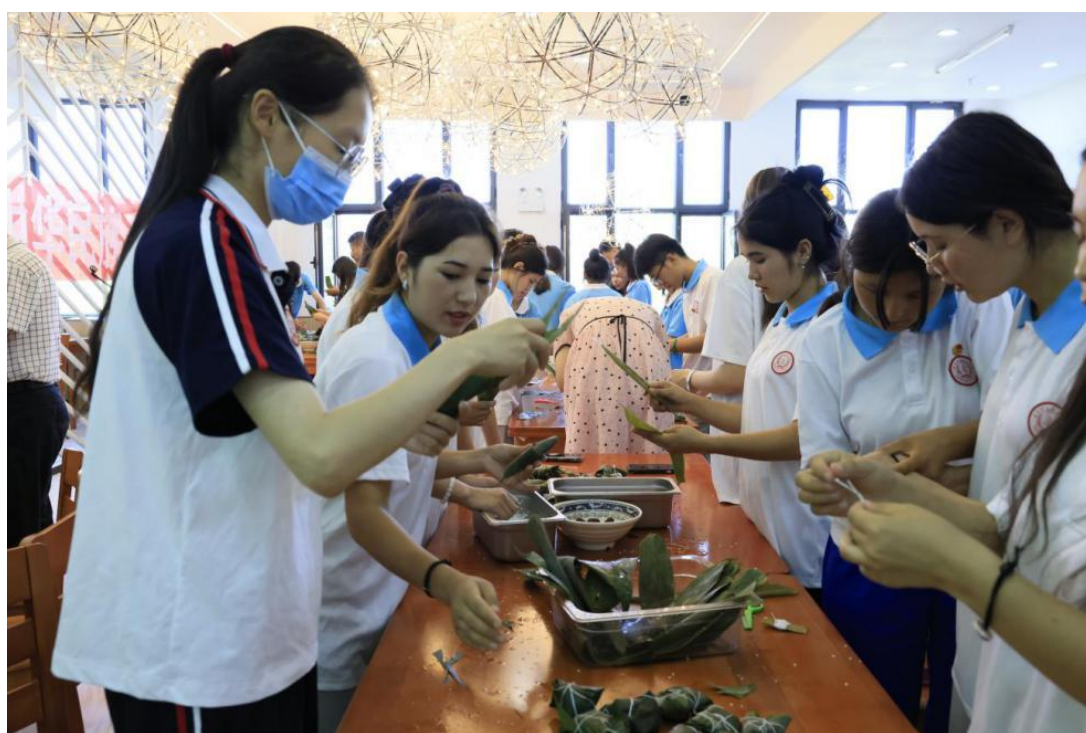
图 32：学生们在包粽子