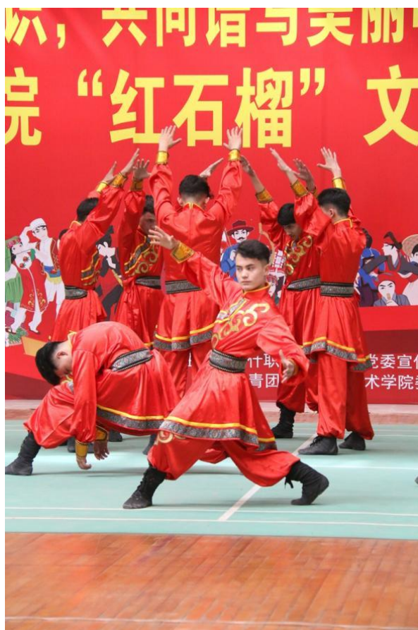
图 33：红石榴文艺展演