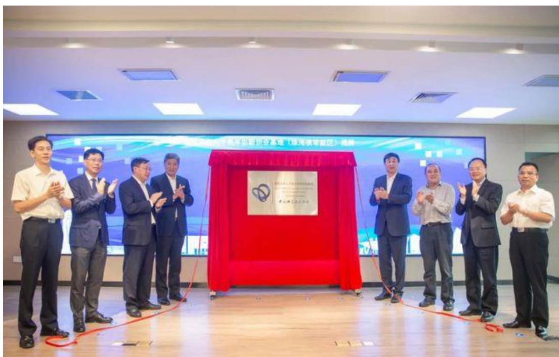
图 15：创新创业指导办公室揭牌仪式

本次授牌仪式本着互惠互利、互相支持的原则，将进一步促进产、学、研相融合，增强师生的实践能力、创新能力，培养双向人才。今后，我校还将继续加大学生创新创业工作力度，将创新创业教育融入整个人才培养过程，不断激发广大师生的活力和创造力，力争在创新创业指导办公室工作中取得更好的成绩。