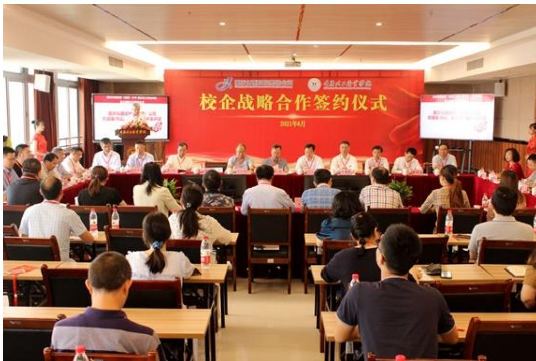
图 56：校企合作签约仪式