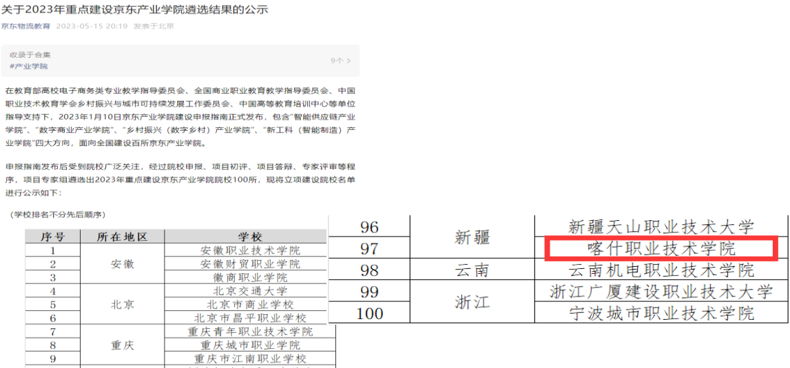
图 45：立项百所京东产业学校建设院校

学校将通过该产业学校的建设和运行，将实现专业群的产教深度融合，建立校企合作、工学结合、知行合一的双元育人机制，共创技能型、复合型、应用型人才培养生态体系。