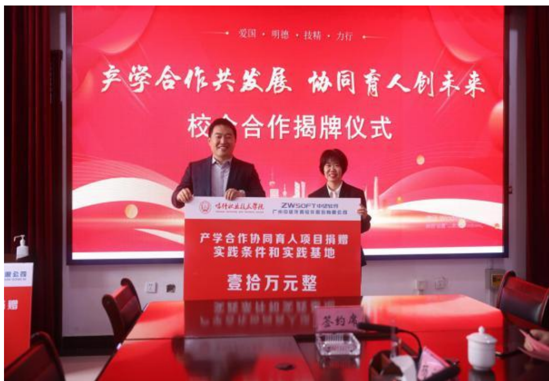
图 49：教师代表接受企业捐赠的软件设备及师资培训项目

习和就业的平台；另一方面，为企业的长远发展提供强有力的支持，更为符合地区产教融合特色建设添砖加瓦。