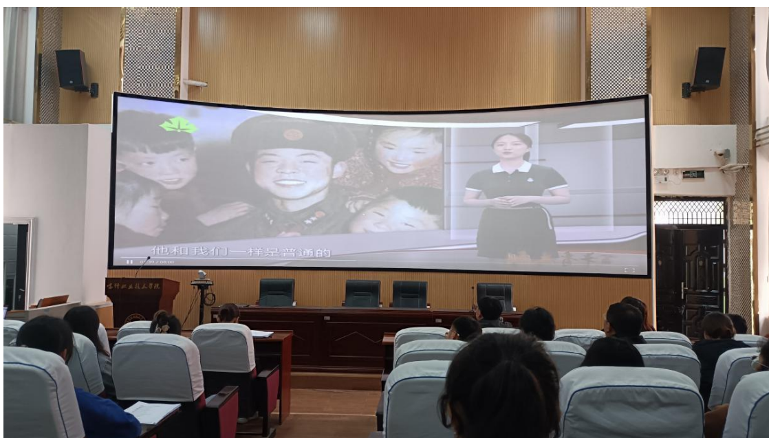
图 53：观看“一颗小小的螺丝钉——雷锋精神”

此次入党动员会，加深了党组织和团组织的联系和交流，紧紧地把他们凝聚在党组织的周围，从思想上激发出他们向雷锋同志学习，争取早日加入党组织。