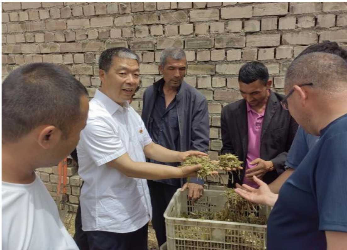
图 17：范振先教授为养殖户指导科学养殖