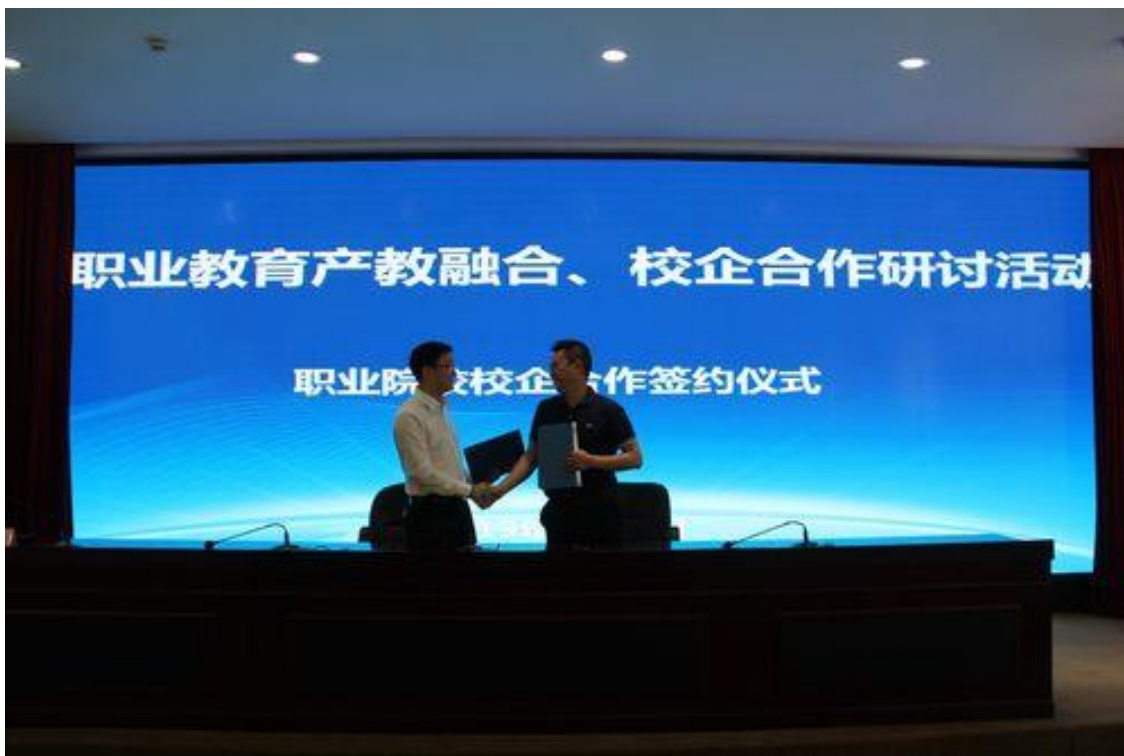
图 43：签订校企合作框架协议