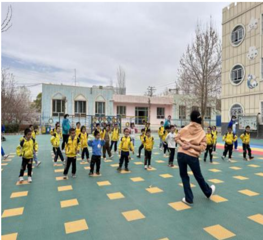
图 16：学前教育专业学生带领幼儿户外活动