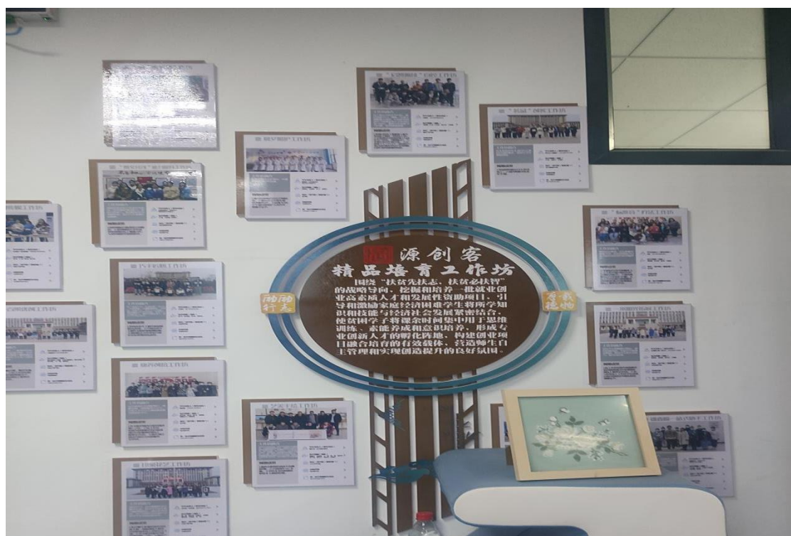
图 14：“源创客”精品培育工作坊

举办各类创新创业活动，如创意市集、创新创业大赛、创业沙龙等，激发学生的创新思维，培养团队协作和沟通能力，为未来的创新创业之路打下坚实的基础。