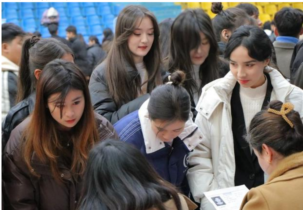
图 20：招聘会现场人头攒动

本次专场招聘会的成功举办，不仅为学生的实习、就业提供了更多的机会和选择，也为系部和企业之间的合作搭建了良好的平台。后续，学校将继续加强与企业的合作，共同推动人才培养和实习就业工作。