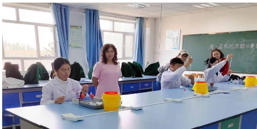
图 27：比赛现场——技能考核

比赛严格按照竞赛流程公平、公开、公正进行。参赛选手们自信沉稳、专注大方、聚精会神、沉着应战，有条不紊地完成一系列操作，展现了较为扎实的理论功底和实践水平。裁判员严格按照评分标准，认真观察选手操作，对选手的表现进行客观评价。选手们饱满的精神面貌和良好的专业技能，展现出了物流服务与管理学子严谨、专业的职业素养。技能竞赛激发了学习兴趣，强化了技能训练，有助于学生将专业知识学习与职业技能相结合。