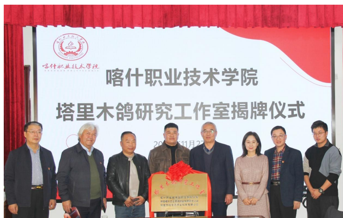
图 59：塔里木鸽工作室挂牌

工作室将紧盯自治区产业集群战略，围绕地区产业发展需求，锚定目标不动摇，直面问题不绕道，压实责任不架空，把研究做在田野中、论文写在鸽舍里，力争在制约鸽产业发展关键技术上取得突破，实现教育、科技、人才一体化推进，为产学研协同发展集蓄内生动力。