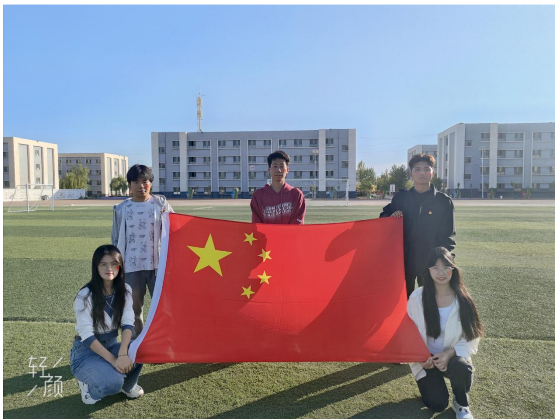
图 47：我和国旗合个影