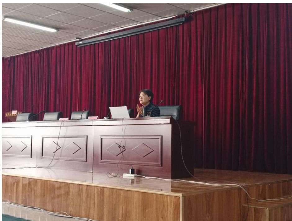
图 36：冯犁教授举办班级管理讲座