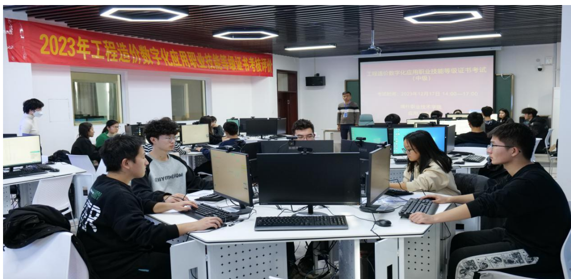
图 30：学生参加工程造价数字化应用证书考试

和专业人才培养水平，为学生提供提升职业技能、强化综合素质、提高就业竞争力的平台。