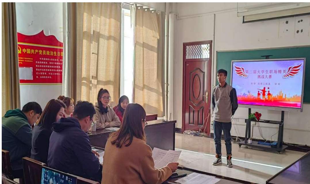
图 19：职场精英挑战大赛就业赛道

此次比赛为广大学生深入了解职场，认清就业形势，正确认识自己，唤醒职业意识，打造职业优势，转变择业观念，适时调整就业期望值，为实现自己的职业梦想而奋斗。