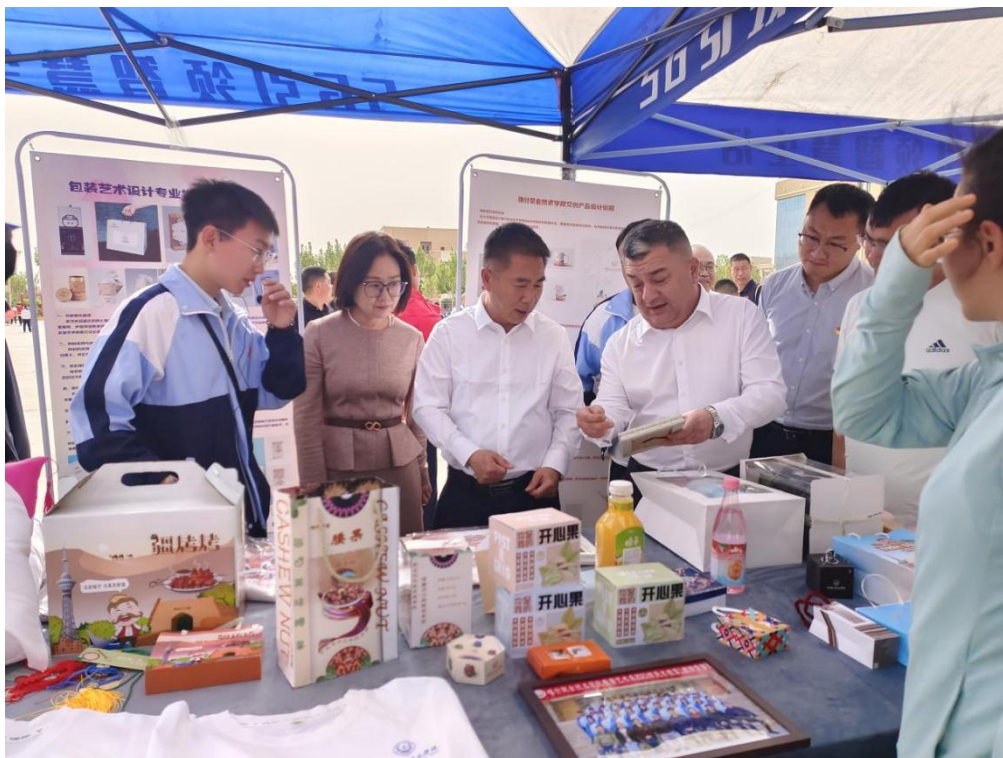
图 25：包装文创展览现场

2.1.6 技能大赛。 学校以促进学生技能发展为中心，深化人才培养模式改革，推动“岗课赛证”融通，推动“大国工匠”培养计划，将学生参加技能大赛、文体比赛作为提高人才培养质量的重要抓手，坚持以赛促学、以赛促教，积极构建“校赛、省赛、国赛”有效衔接的三级竞赛管理体系，搭建学生成长与展示的平台，助推人才培养质量提升。