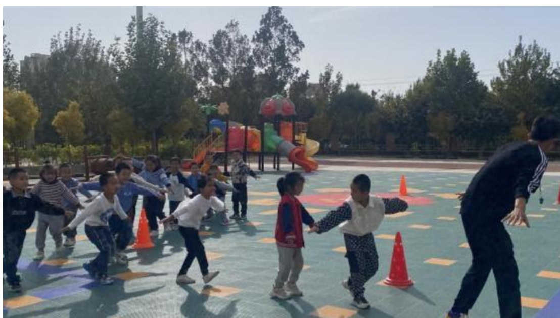
图 8：喀什市军民同心幼儿园一日体验

同学积极提问，老师耐心解答，融洽的氛围消除了新生对专业的陌生感，帮助新生强化了专业认知，对就业前景、职业发展、学业规划等方面有了较为全面的认识。