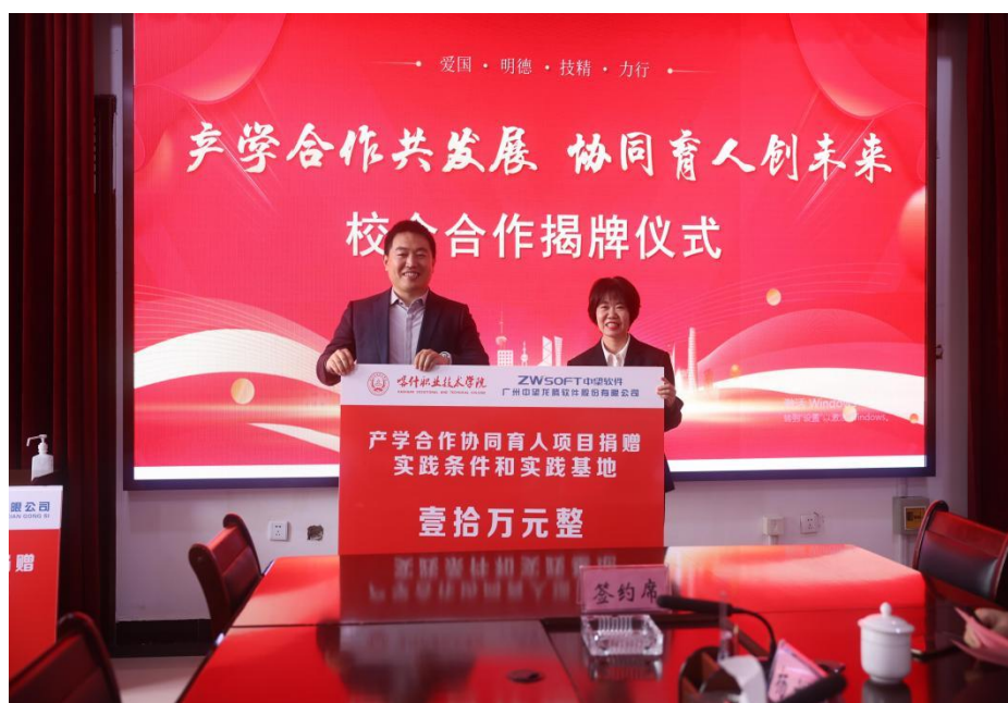
图 56：企业向学校捐赠款物

企业非常重视同学校的合作，捐赠价值二十二万元的软件设备及师资培训项目，标志学校与企业的紧密合作迈出坚定的一步。一方面，通过与企业深化合作，为教师提供企业实践的资源 and 机会，为学生提供学习和就业的平台；通过与学校的深化合作，企业可以充分发掘和培养潜力人才，在发展中快人一步，为长远发展提供强有力的支持。