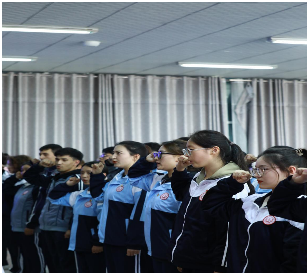
图 3：新团员在老团员带领下宣誓