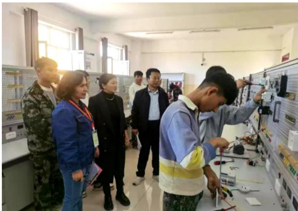
图 29：电工技能大赛现场