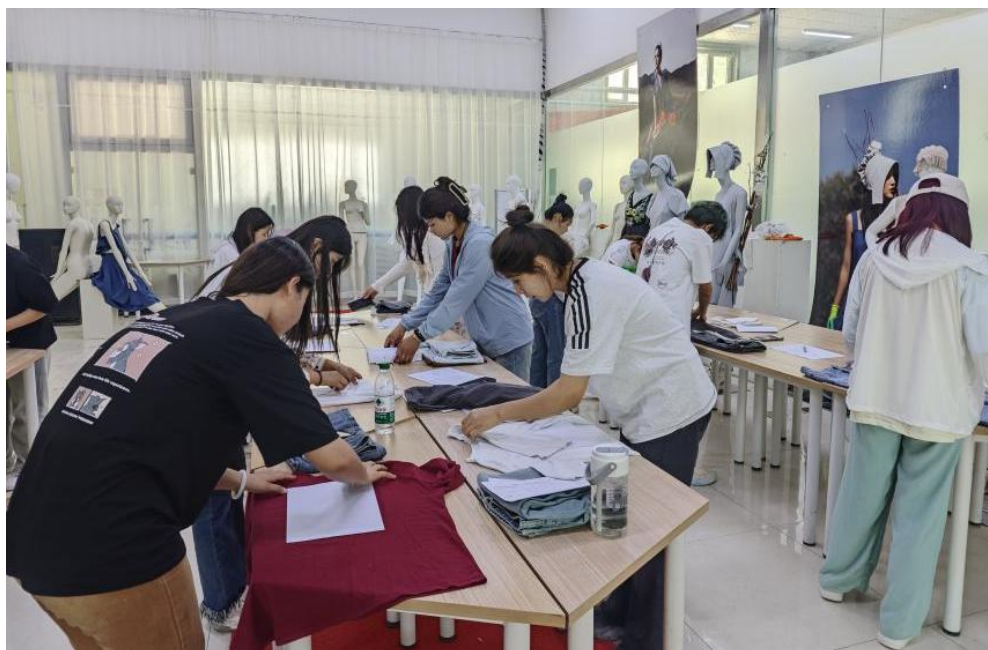
图 31：考生进行叠装实操

2.3.2 课程建设质量。 学校以就业为导向，根据专业培养目标和职业岗位任职要求，以专业核心课程建设为重点，课程体系对接职业能力、课程内容对接职业标准、教学过程对接生产过程，围绕职业岗位能力需求，确定教学内容，以专业核心课程改革为切入点，课程设计科学，教学目标清晰，内容符合政治性、科学性、先进性、适用性、规范性要求，融入新方法、新技术、新工艺、新标准，开发适合学情的课程资源。