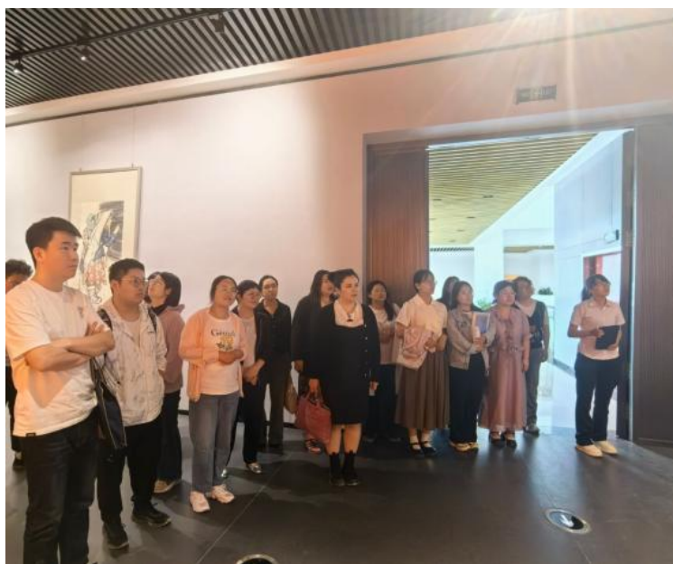
图 45：参观喀什大学思想政治教育基地