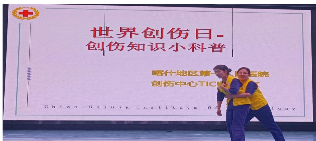
图 11：医护人员演示急救方法

医护人员用实操演练形式给学生展示心肺复苏的基本流程，并邀请同学亲身体会心肺复苏全过程。在互动环节中，学生咨询海姆立克急救法的正确做法，医护人员详细介绍并示范。通过宣传活动，学生提高了日常生活的自我防范意识，认识到平时生活中的误区及有可能造成的危害，普及日常生活中常见损伤的正确的处理措施，减少二次伤害的风险。