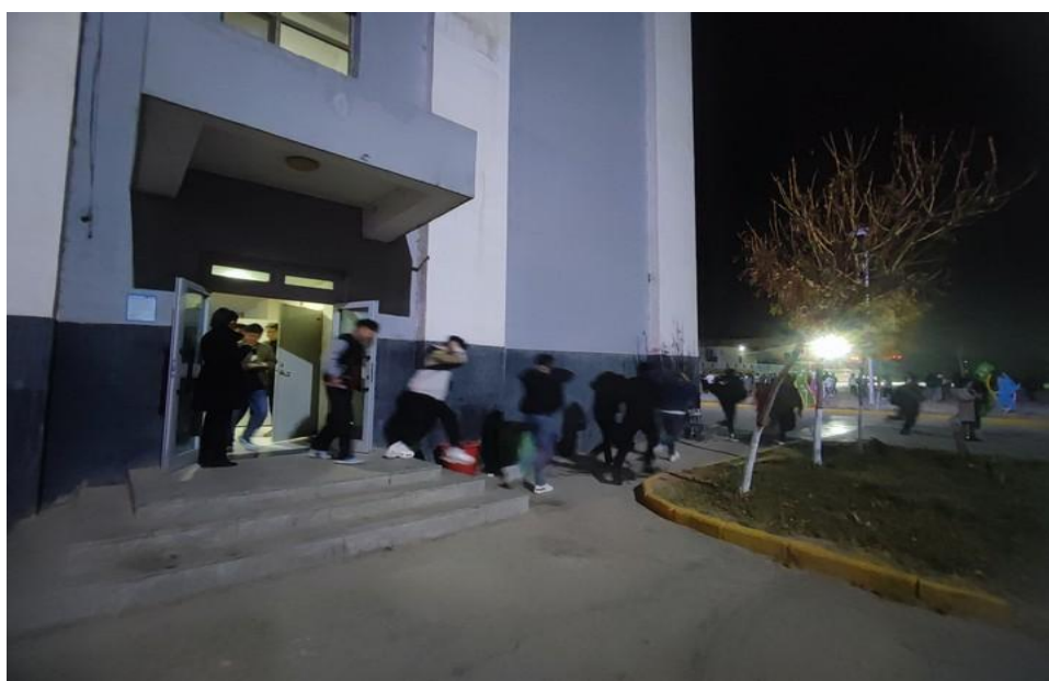
图 13：师生开展地震应急演练

22:29 分，师生听到“警报”后迅速响应，由宿舍楼到足球场整齐列队仅用时 57 秒。在演练过程中，同学们听从指挥、反应敏捷、动作规范、团结互助。当日值班教师对演练进行总结，提出存在的问题和不足，强调全体师生要时刻保持对生命的敬畏，认真对待每一次演练。通过演练进一步提高了师生的安全防范意识和应对灾难的逃生能力，提高了突发自然灾害的应急反应能力和自救能力。