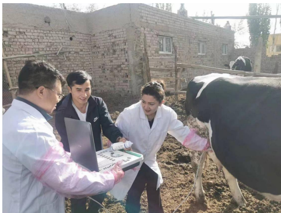
图 55：用便携式 B 超探测怀孕母牛胎儿发育情况

秋季是药浴杀虫的“黄金期”。牲畜药浴是预防寄生虫的有效措施，集中药浴不仅能洗掉羊身上的污垢，促进生长发育，还能杀菌消毒，消灭体外寄生虫病和预防疥癣病。建议驻村工作队按时组织养殖户开展“药浴”工作，促进牛羊生长发育，减少疫病发生，提高养殖户的收入。