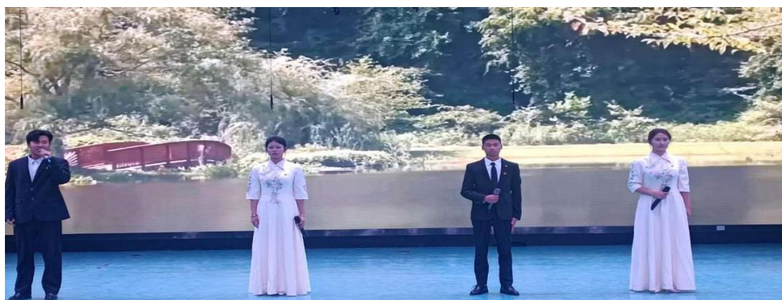
图 48：学生宣讲员开展宣讲

理论宣传是加强党的政治建设的重要内容，是让党的理论最迅速最广泛地同群众见面并入脑入心的基本途径。本次宣讲取得了预期效果，我们会以此次活动为契机，进一步丰富宣讲形式、提升宣讲作品质量，推动习近平新时代中国特色社会主义思想入脑入心入行。