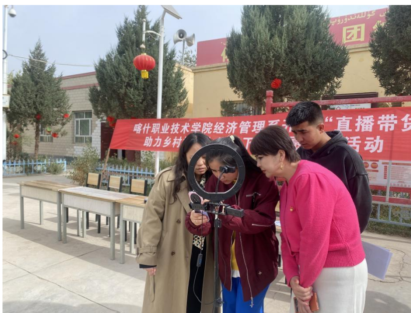
图 42：师生指导村民开展直播到货

学校将充分发挥学校教育资源、人才资源优势，履行职业教育服务“三农”的责任，推进人才培养与服务喀什地区深度融合，培养农村高质量发展所需的技能人才，助力乡村产业，赋能乡村振兴。