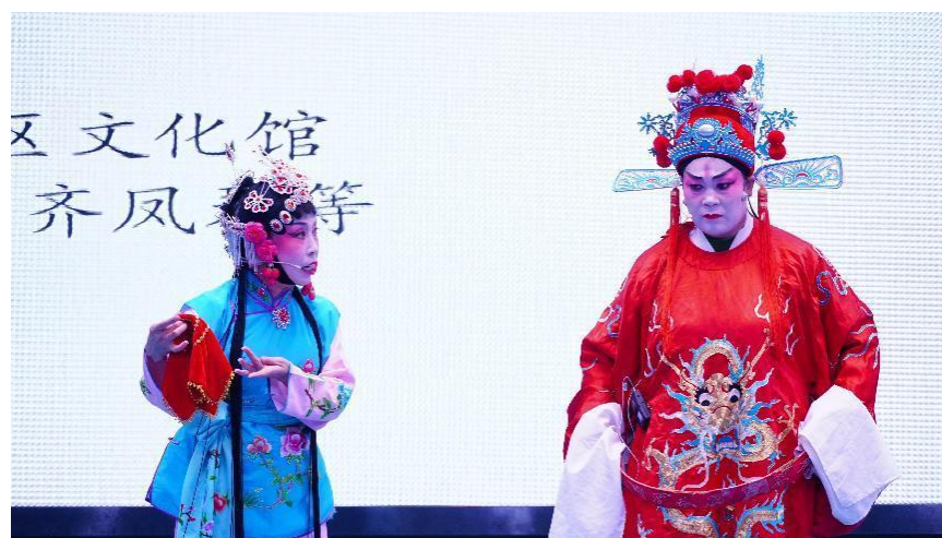
图 46：喀什地区文化馆秦腔《花亭相会》

认识到戏曲文化的多样性和丰富性，为优秀传统文化传承发展营造了良好的土壤和环境，是一次充满意义的“播种”。