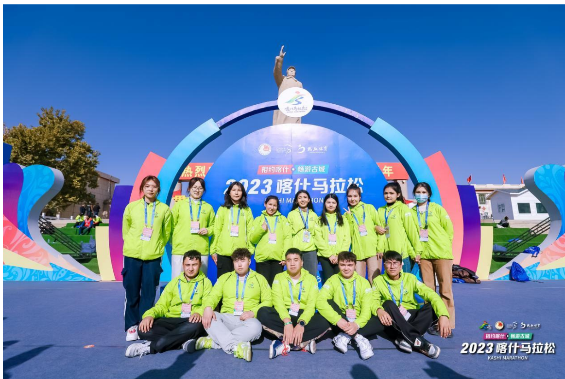
图 43：志愿者合影留念