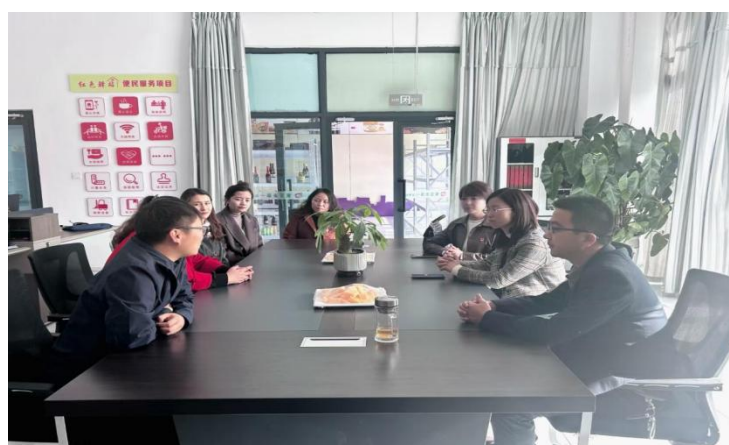
图 58：访企拓岗在行动

此次访企拓岗行动，为校企双方在更广阔领域协同发展搭建了平台，拓宽了毕业生就业基地的范围，也为提高学生就业质量、服务地方经济发展创造了条件。