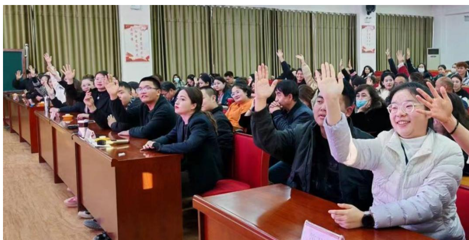
图 4：观众答题互动环节

通过“党建带团建”，营造浓厚的理论学习气氛，培养学习的能力和优良品行，激发学习兴趣及能力，达到学会感恩、热爱祖国、铸牢中华民族共同体意识的目的。