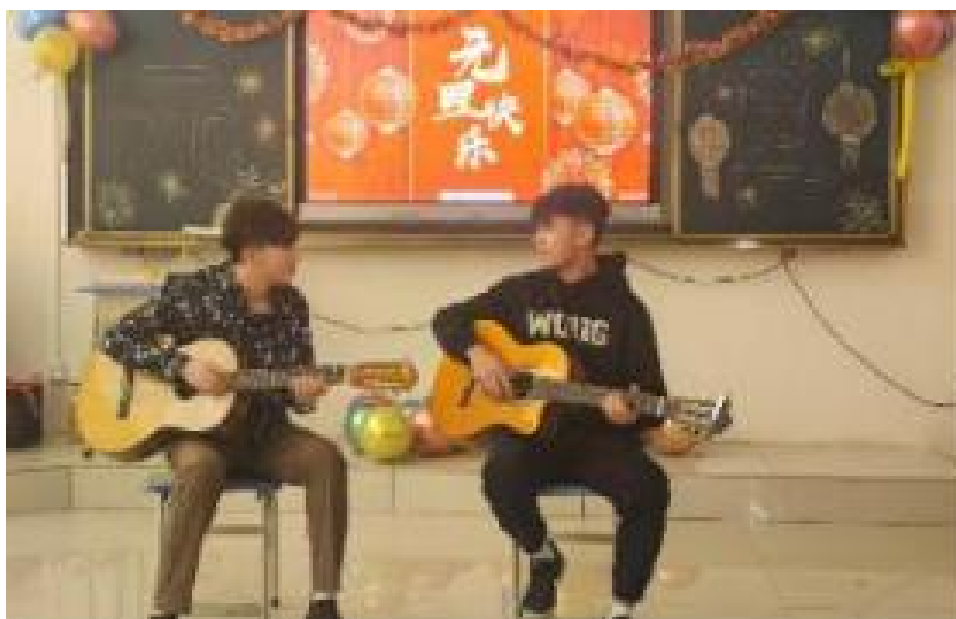
图 18：2022 级计算机 1 班活动现场

年年岁岁花相似，岁岁年年人不同。文艺活动活跃了系部的学习氛围，加强师生之间的沟通，增强了班级的凝聚力，增进了同学间的友谊。这些舞蹈、音乐给同学们带来了乐趣，也获得了喜悦。