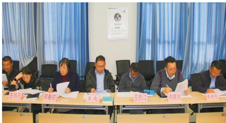
图 38：学术委员评审“双师型”教师

学术委员对标认定条件和依据，核对申报材料，对争议展开讨论后合议认定。学校将加大“双师型”教师培养力度，引领教师向“双师型”方向发展，提高教师队伍的专业技能水平，构建一支素质优良、技艺精湛、专兼结合的高素质专业化的“双师型”教师队伍，持续助推学院高质量发展。