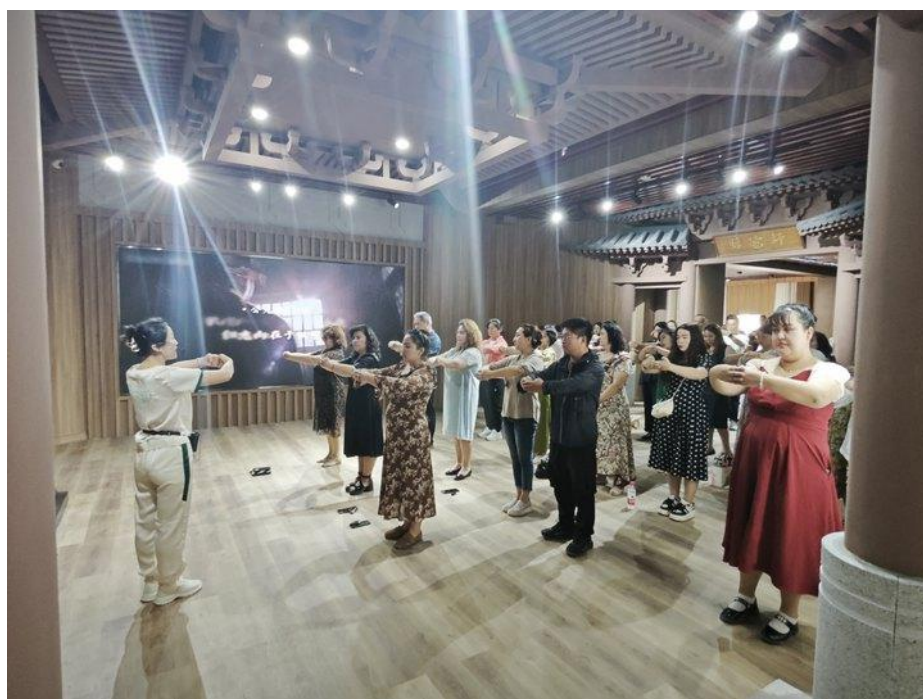
图 34：向万世师表孔子行拜师礼