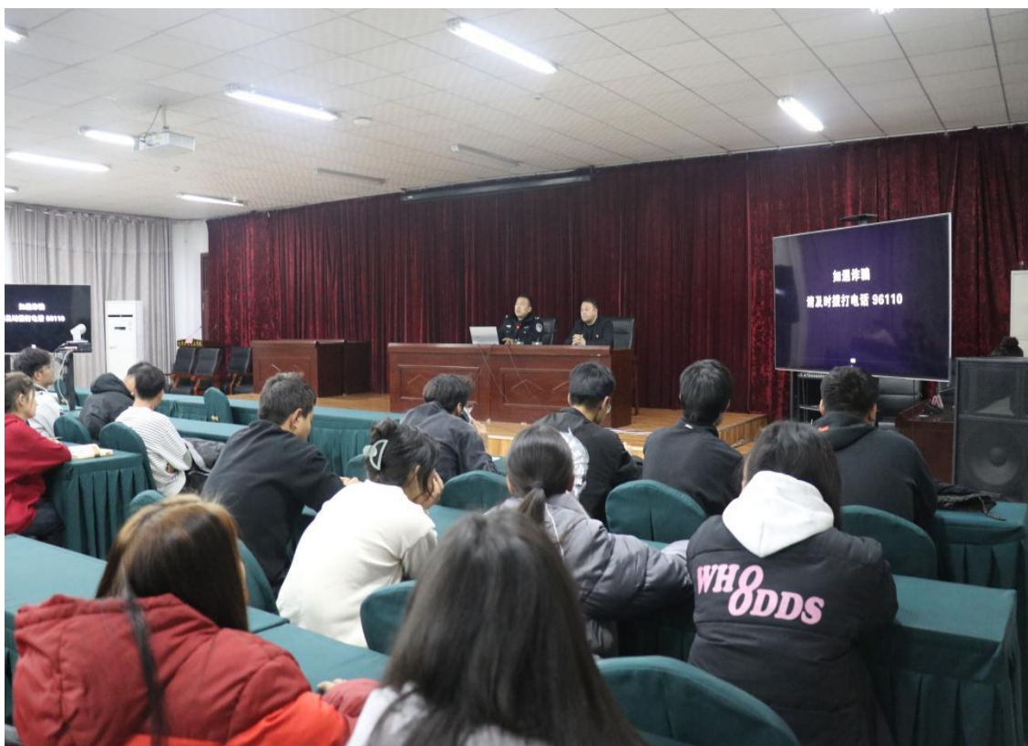
图 15：派出所民警开展法制专题教育

同学们听到身边发生的各类诈骗事件后，纷纷表示要增强防范意识，下载使用国家反诈 APP，在日常学习生活中自觉践行社会主义法治观念、遵守法律法规。