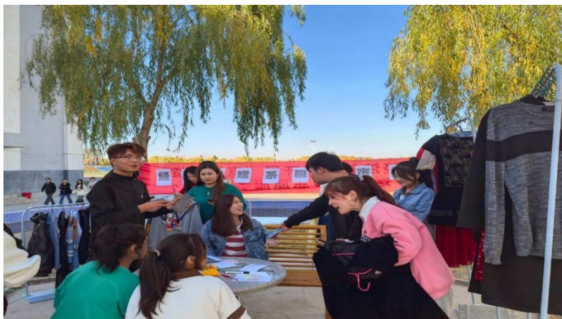
图 23：“跳蚤市场”正式营业

不仅给学生提供了互惠互利、友善互动、团结协作的平台，也增强了创新创业意识，为高质量就业打下良好基础。