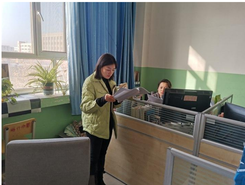
图 33：进教研室开展随机检查与交流