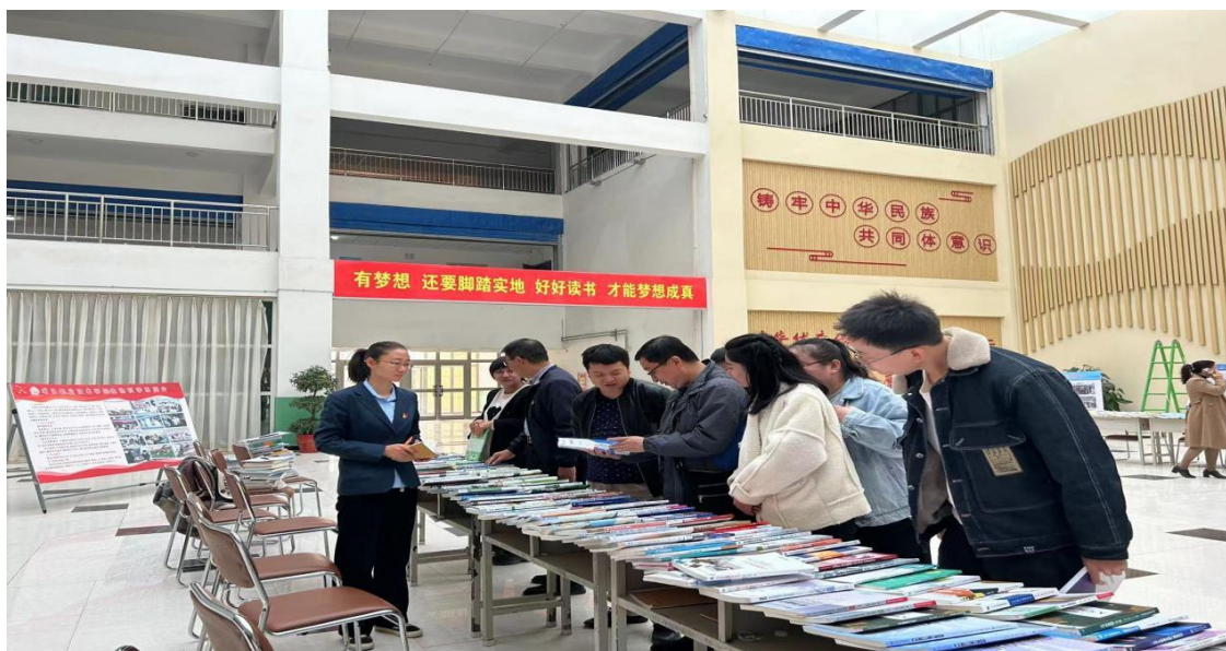
图 32：“专业教研室组队”参与书展活动