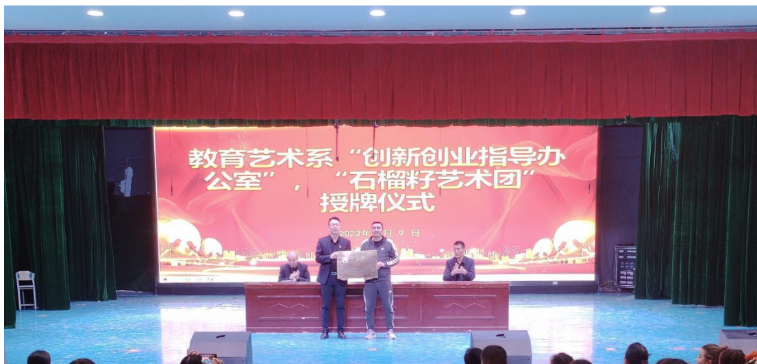
图 22：教育艺术系创新创业指导办公室授牌