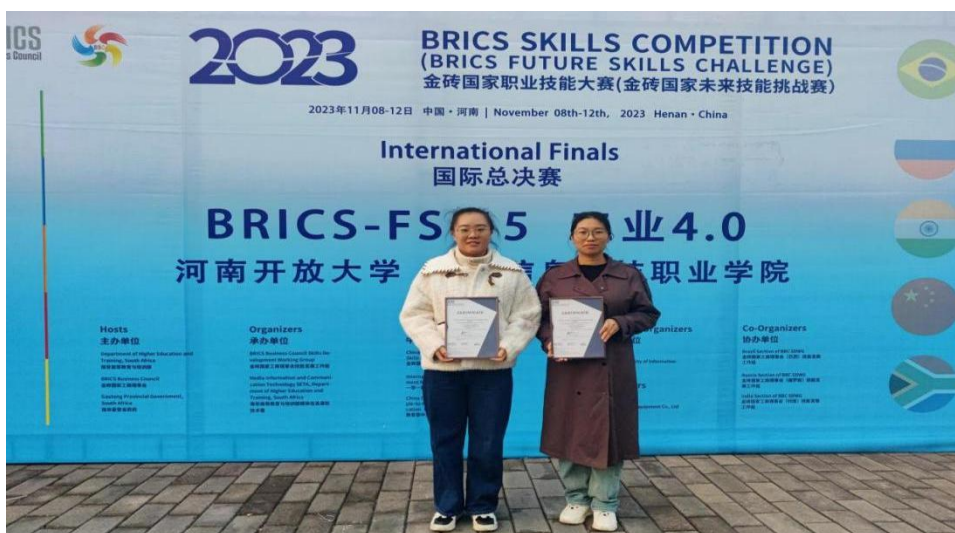
图 50：学校取得国际大赛的第一个奖项