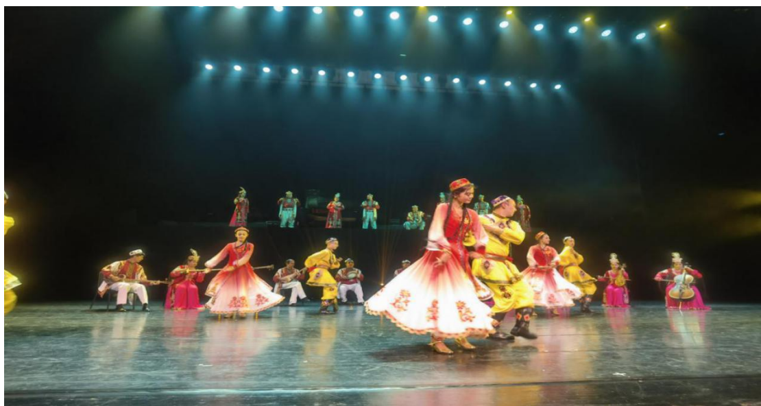
图 51：《十二木卡姆》“赛乃姆”部分