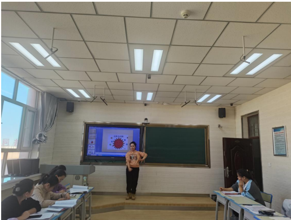
图 37：学前教育专业说课比赛