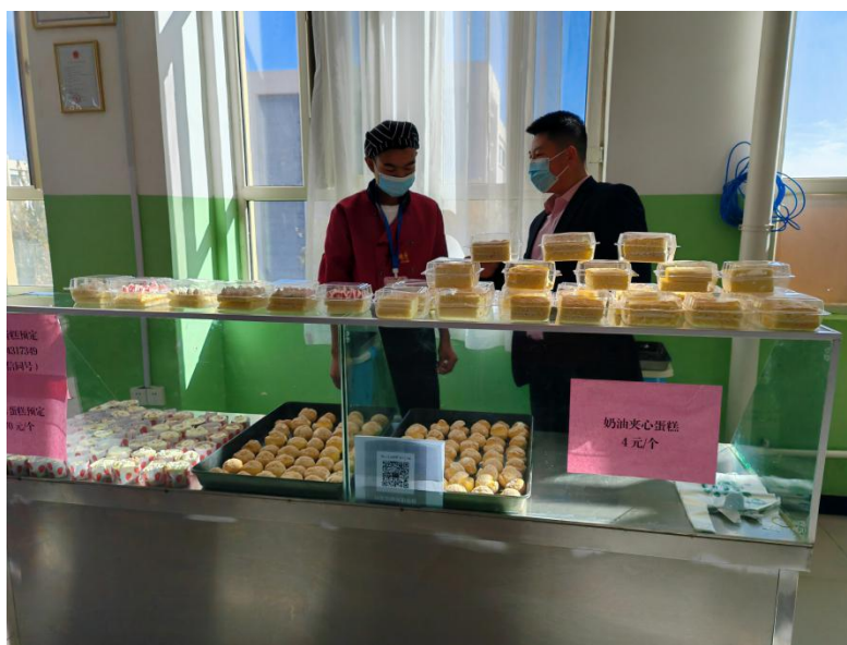
图 24：创新创业蛋糕坊 3 号食堂销售点