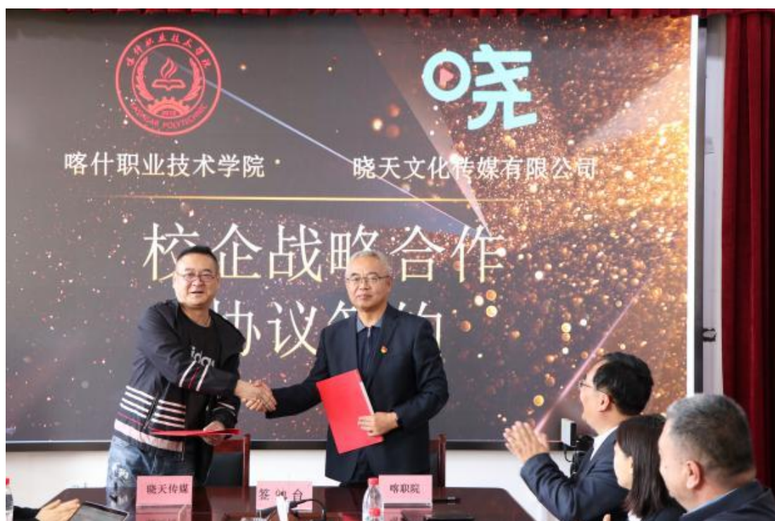
图 52：与晓天文化传媒有限公司签订战略合作框架协议

产教融合、校企合作是培养高技能人才的有效途径，学校将以本次签约为契机，加快高素质技术技能人才培养步伐，为经济高质量发展提供强有力的智力支持和人才保障。