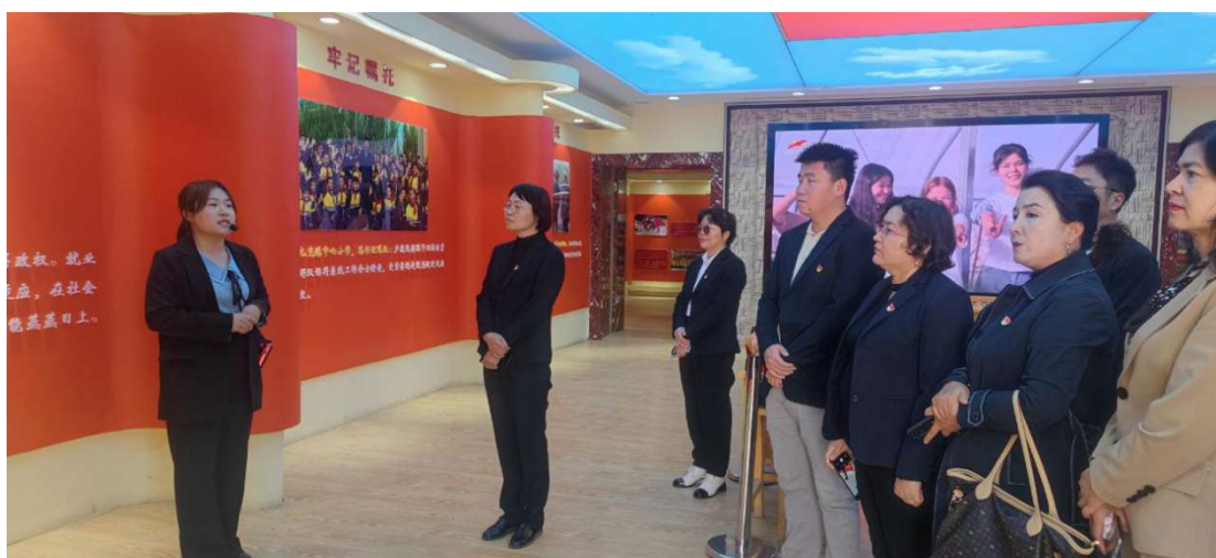
图 5：参观阿亚格曼干村爱国主义感恩教育基地

这是一次深刻的党性教育和思想灵魂的洗礼，对我们党始终践行为人民谋幸福、为民族谋复兴的初心使命有了更加深刻的理解。以此次现场学习为契机，让主题教育入脑入心，学深悟透总书记考察新疆时的重要讲话和重要指示精神，完整准确贯彻新时代党的治疆方略，把思想伟力转化成为干事创业的强大动力。