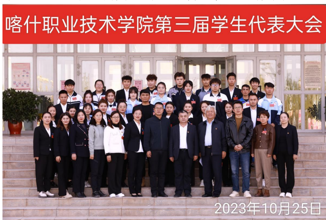
图 10：第三届学生代表大会顺利召开

根据大会选举办法，经无记名投票，选举产生第三届学生会委员会、第三届学生会主席团。选举过程公开透明、公平公正。让我们用青春、智慧和力量，诠释青年担当！