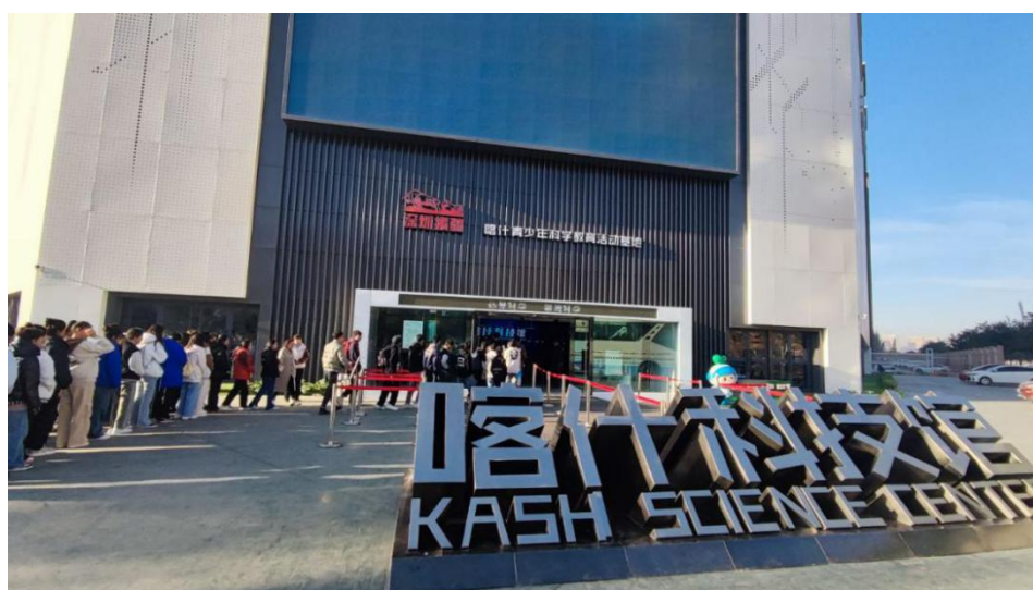
图 60：同学们参观喀什科技馆

通过参观，同学们开阔了视野，丰富了知识，感受到了科技的神奇魅力、祖国的日新月异，纷纷表示要奋发图强，树立远大理想，用双手和智慧去创造和探索科学奥秘，为中华民族的伟大复兴贡献自己的一份力量。