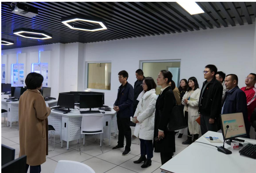
图 41：参观电子商务专业实训中心

两校交流促提升，携手同行谋发展。喀什市中等职业技术学校团队的到访，加深了两校间的友谊，为进一步交流学习奠定坚实基础。