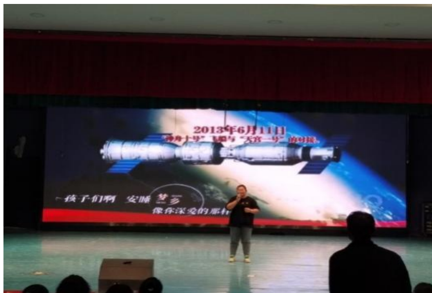
图 44：选手讲述“航天报国”故事