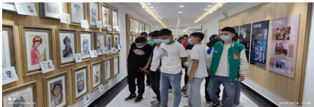
图 28：学生们了解专业设施设备情况

欣赏了学校美术专业师生的作品。通过参观，新生纷纷表示，自己要在未来的学习中要好好学习专业技能、文化知识。不虚度年华，努力在喀什艺术学校实现自己的艺术之梦。