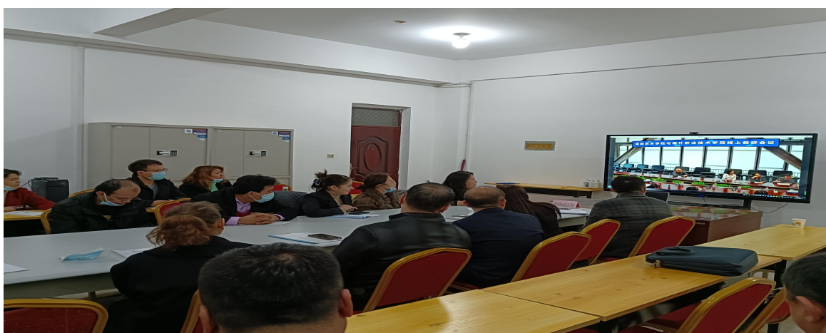
图 26：与深圳艺术学校线上教研会议

此次教研活动，我们认识到作为一名教师，最重要的就是要以发自心灵深处对学生的爱，去挖掘学生内在的积极因素，激发学生自我肯定的积极情感，并转化为学生自信、向上、进取的动力，从而达到教人，育人的目的。让我们怀揣教育的初心，以乐教化，用爱去教育学生。