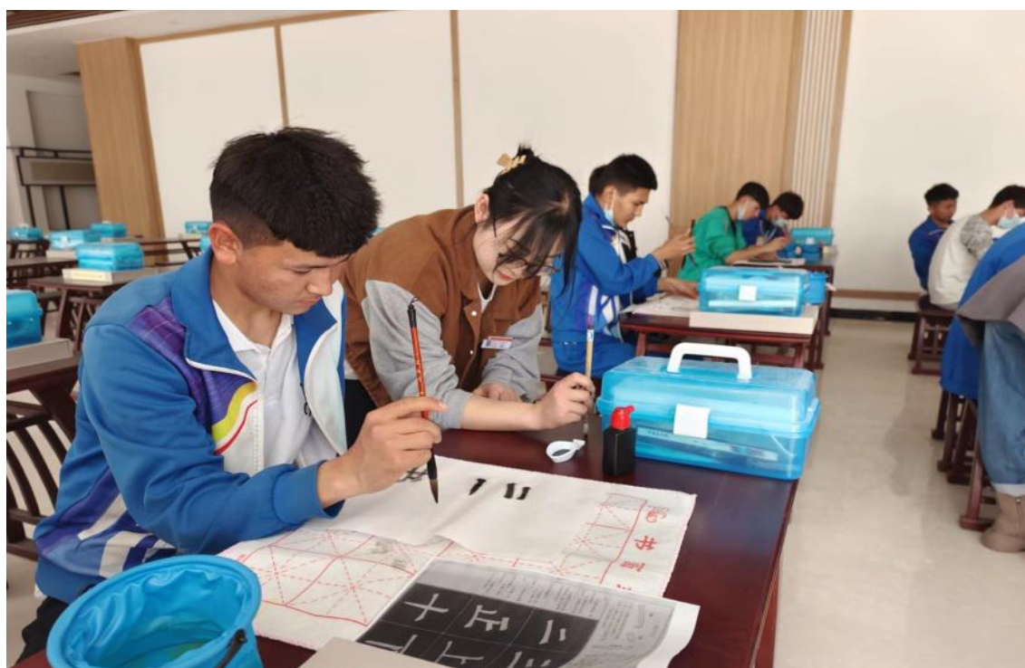
图 49：学生练习毛笔字

通过此次活动，既丰富了学生的文化生活，培养了学生的书法兴趣和爱好，同时也提高了大家的审美意识。