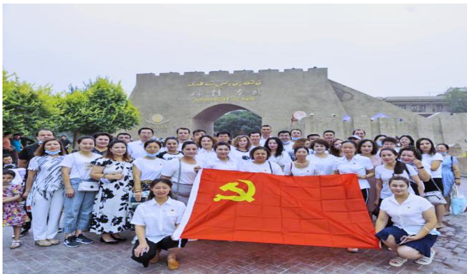
图 4 党建引领，夯实发展

高质量推进党史学习教育。学校多次组织学生、党员进行党史诵读和演讲比赛，深入班级开展党史学习教育宣讲活动，引领青年学子积极向党组织靠拢，推动党史学习教育入脑入心、走深走实。学校积极响应“五育并举”育人模式，举办“喜迎二十大”党建知识竞赛活动，丰富思政育人内容。专业教师通过深入挖掘艺术专业的思政元素，将红色文化融入课程思政，在“润物细无声”中潜移默化教育学生。