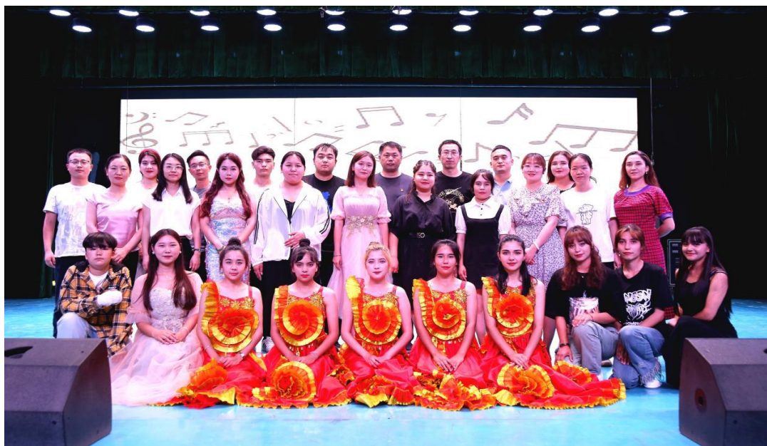
图 8：内容丰富的第二课堂