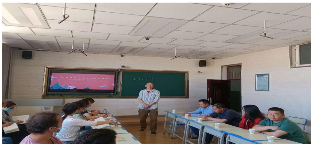
图 25：立足文化产业需求，落实文化润疆工程

此次交流会中，上海援疆教授对高职歌舞表演专业岗位设置、人才培养方案、专业建设、课程标准的要求做出了详实的讲解，并提出了客观存在的困难，例如：团队师资要求相对薄弱等问题。专业教师们也各抒己见，针对专业课程建设、人才培养方案和地方政策方面，发表了自己的建议。各位专家也对专业建设提出了自己中肯而宝贵的意见。研讨中，教务科长针对高职歌舞表演专业申报工作中反映出的实际问题给予经验方面的指导，同时鼓励申报团队克服困难，继往开来，抓住专业特色，力争申报工作圆满顺利。