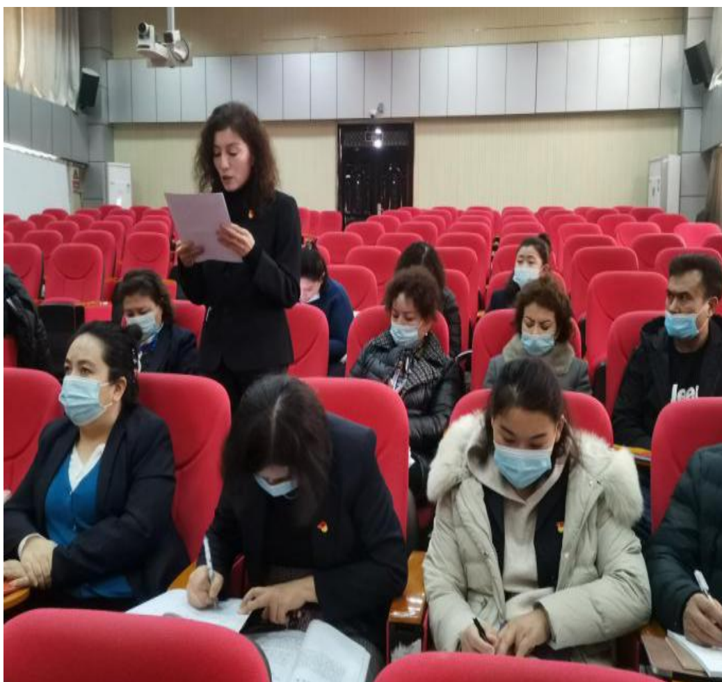
图 10：党员代表分享从严治党、党风廉政建设心得

外人”的标准，提高认识，提高政治定力，坚定理想信念，担负起廉政建设政治责任；全体党员干部要进一步树牢党章意识，自觉学习党章、遵守党章、贯彻党章、维护党章，做政治上的“明白人”。