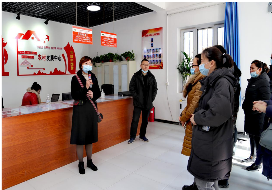
图 7：关心爱护困难学生，帮扶贫困党员

发挥专业优势，开展形式多样、内容丰富的第二课堂。创新党建工作形式，丰富学生课余生活，培养了学生高尚品德。学校开展志愿活动 10 余次，服务师生有温度，总能看到党员们服务师生的身影，“亮显”“弯腰”“正气”，用实际行动说话，明确了党员的使命与担当。让党建工作“走心又有新”，“动”起来、“活”起来，以活动方式创新拓展思想政治教育形式。