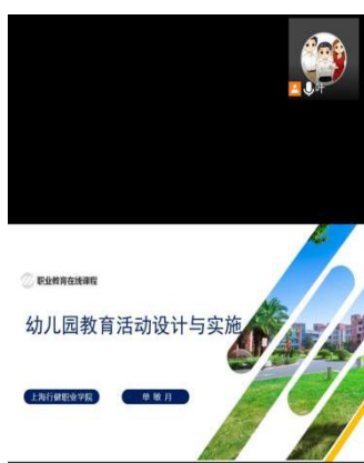
图 34：上海行健喀什艺校课程思政教学研讨

人生百年，立于幼学。学前教育阶段是人生的奠基阶段，为贯彻落实立德树人的根本任务，发挥思政育人主体作用，帮助学前教育专业教师进一步了解课程思政的有效性与实施，10月21日，上海行健学院学前教育系与学前教育教研室全体教师线上召开“课程思政”专题研讨活动。