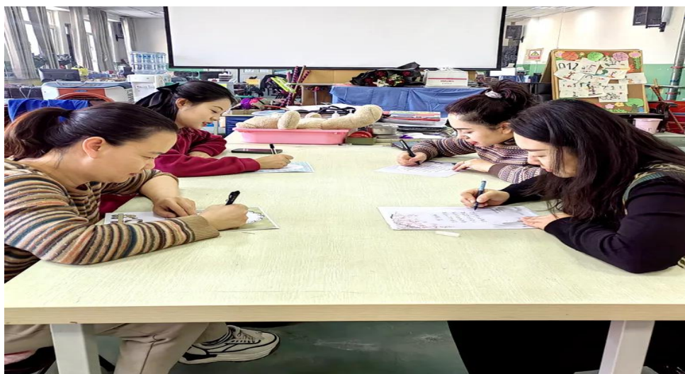
图 50：教师正在临摹古诗词

了党员的文化自信，同时在团队建设和沟通合作方面也取得了显著的效果，加强了党组织的凝聚力和战斗力。