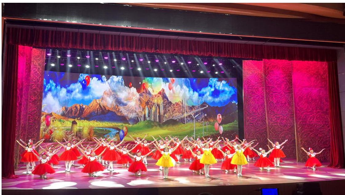
图 39: “新歌唱新疆”优秀原唱歌曲演唱会

此次主题展演活动由中国文联、新疆维吾尔自治区党委宣传部、新疆生产建设兵团党委宣传部、中国音协主办，旨在深入贯彻习近平新时代中国特色社会主义思想 and 党的二十大精神，认真落实习近平总书记关于加强和改进民族工作的重要思想，用高质量的文艺创作成果增强各族人民实现中华民族伟大复兴的精神力量。