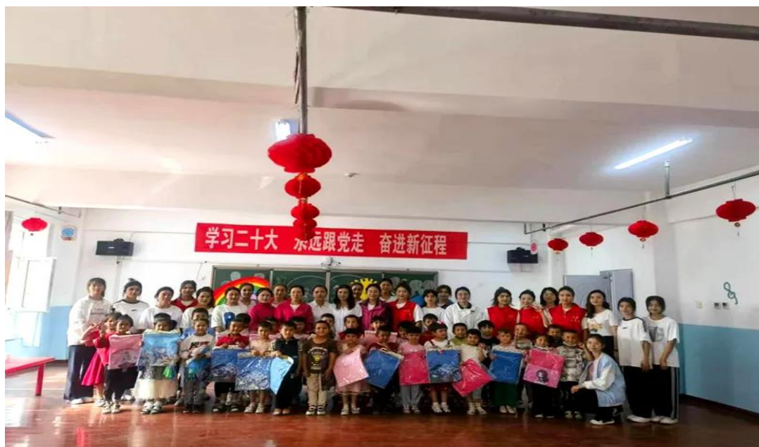
图 41：学生进社区服务社会实践活动

在六一儿童节到来之际，喀什艺术学校团总支组织 25 名学舞蹈、音乐、美术专业学生，于 2022 年 8 月 18 日赴吾库萨克镇中心幼儿园开展了以”学习二十大 永远跟党走 奋进新征程”为主题的大学生进社区社会实践活动。