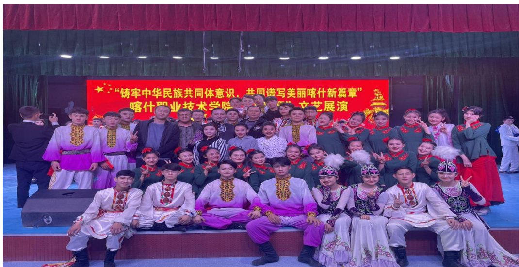
图 17：万方乐奏有于田

今后，喀什艺术学校党员志愿服务队将通过各种形式为广大师生办实事、办好事，让师生在看得见、摸得着中真真切切地感受到党的优良作风。