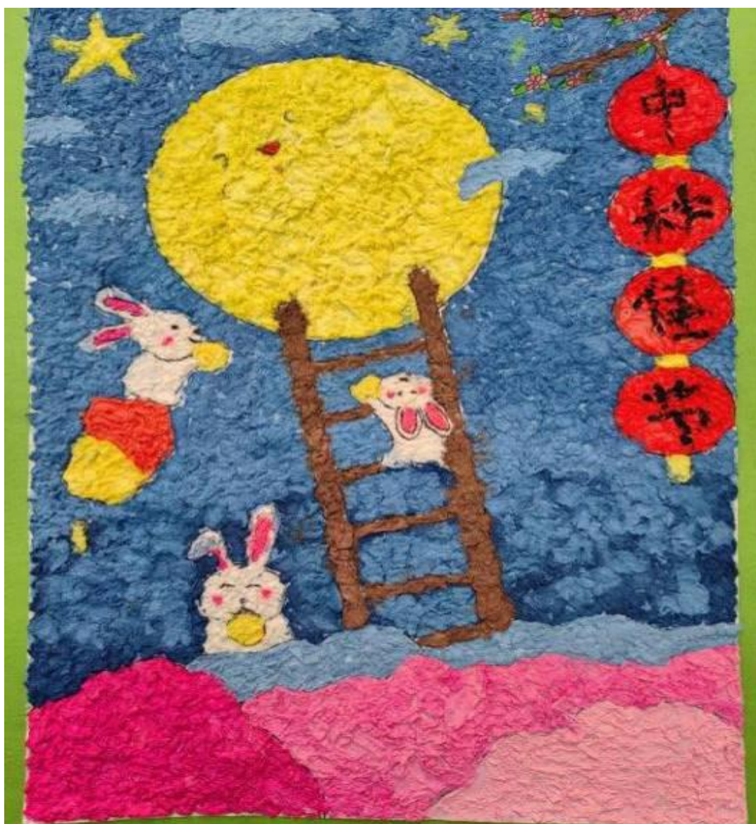
案例 33：弘扬民族文化，书写汉字之美

此次活动让同学们在动手、动脑中感受中华文化的博大精深，感知我国传统文化的多样性，同时丰富了同学们的课堂生活，为 2022 级学前教育专业学生提供了展示自我的舞台，激发了他们创作的兴趣，进一步增强了校园文化氛围。