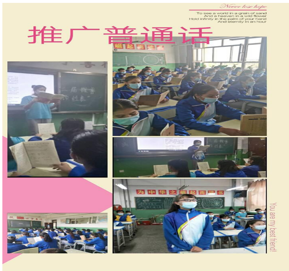
图 18：推广普通话宣传周活动