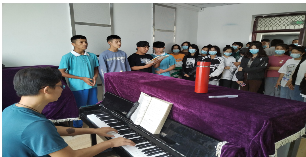
图 31：教师展示演奏技能

通过本次活动,2022 级音乐专业的新同学对音乐专业有了新的认识，更加喜爱音乐，激发了学习兴趣。让学生明白既然选择了音乐专业，就一定要努力学习，学好自己的专业和文化课，在三年的学习中，让音乐能改变自己的人生。