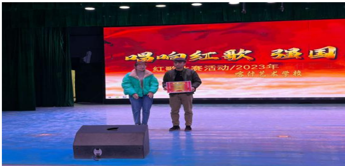
图 3 “红歌”比赛

为更好活跃校园氛围，丰富学校学生的生活，展现现代学生活动才能，更好的增强同学之间的团队精神，发扬学生团结拼搏的友谊精神，喀什艺术学校学生科将为学生举办一次充满活力、展现当代学生的“红歌”为主题的比赛。