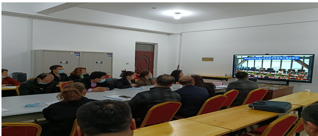
图 33：线上会议进行时

推进实验课项目化管理，鼓励单独开设实验课，积极探索新形势下实践教学与理论教学相结合、实践教学与科学研究相结合、实践教学与社会服务相结合、实践教学与就业创业相结合的实践教学体系，提升学生的动手能力和创新能力。学校制定科学合理的实习教学大纲，精心组织，规范管理，选派责任心强、有指导实习经验教师担任实习指导教师。