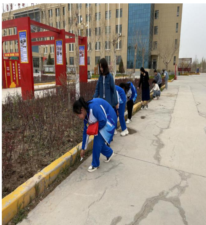
图 12：弘扬雷锋精神，参与志愿服务，倡导文明新风

愿者手持卫生工具，冒着烈日，在道路两旁的绿化带、树坑等处捡拾烟头、垃圾，清洁环境，志愿者们辛勤服务的场景，构成校园一道别样的风景。此次志愿服务活动，充分发挥了党员、团员的先锋模范作用，使校园周边环境面貌焕然一新。志愿者们表示：弘扬雷锋精神，就是要丢弃浮躁，认真求实，深入地干好每一件事。我们要以实际行动，把雷锋精神一代又一代地传承下去，让雷锋精神在中华大地蔚然成风！