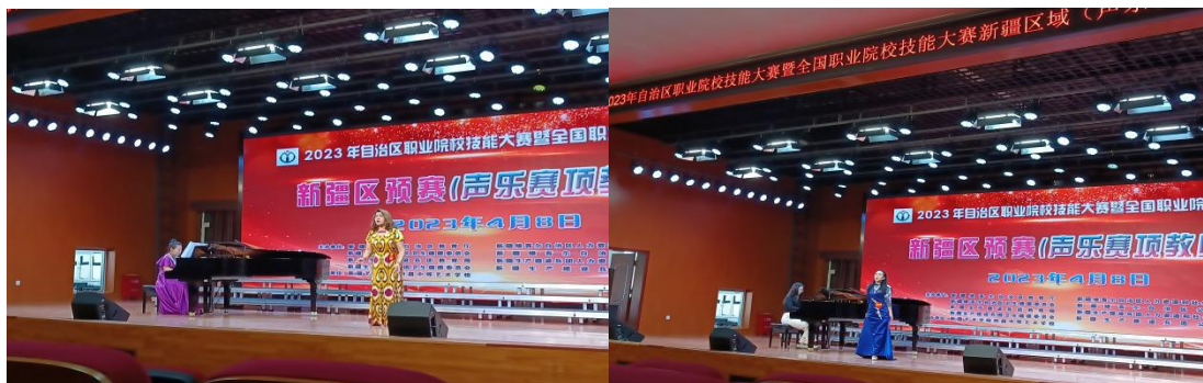
图 22：声乐赛项教师组比赛现场