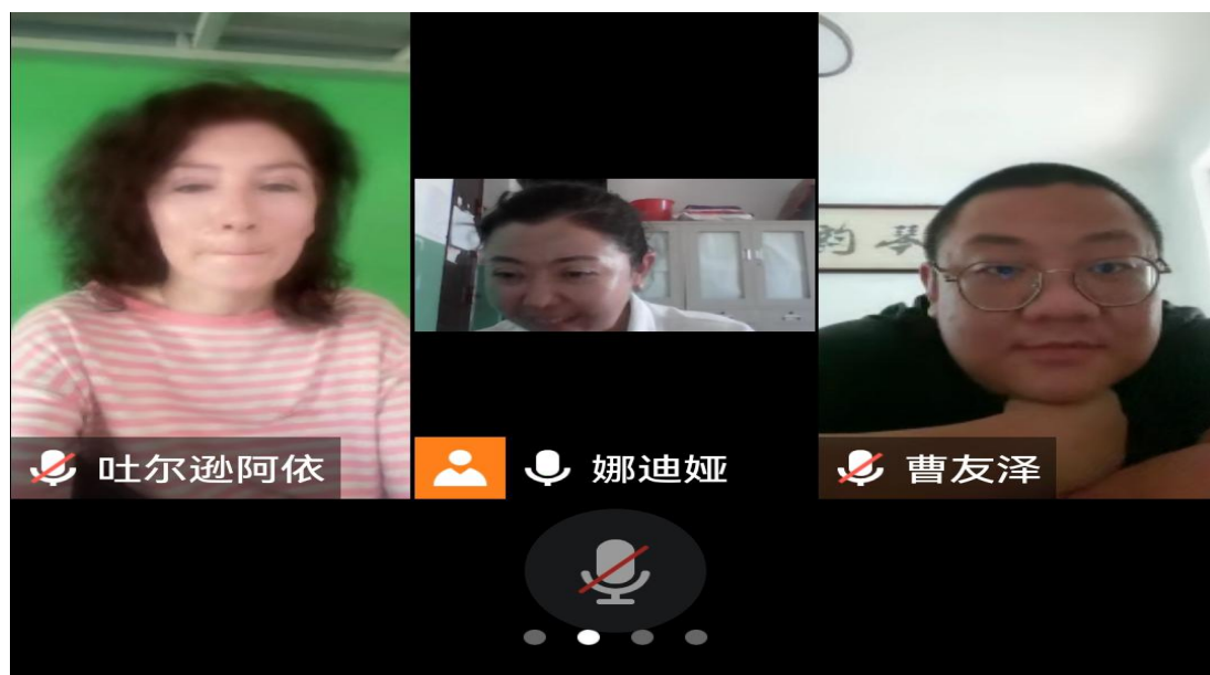
图 14：浓浓尊师意 款款爱生情

各支部积极动员居家教职工参与其中，大大提升了活动效果，增强了党员教师的荣誉感、责任感和使命感。教师们通过线上留言、互赠寄语等各种方式为彼此送上节日祝福。学生也自然没有忘记点亮自己心灵的教师的节日，他们用自己的方式向老师表达着美好的祝福，有的拍摄了祝福视频，有的发来了祝福的话语，还有的亲手为老师制作了手工作品。热心的学生家长也用自己的最朴实的语言为传授知识的教师送来了热情的祝福。