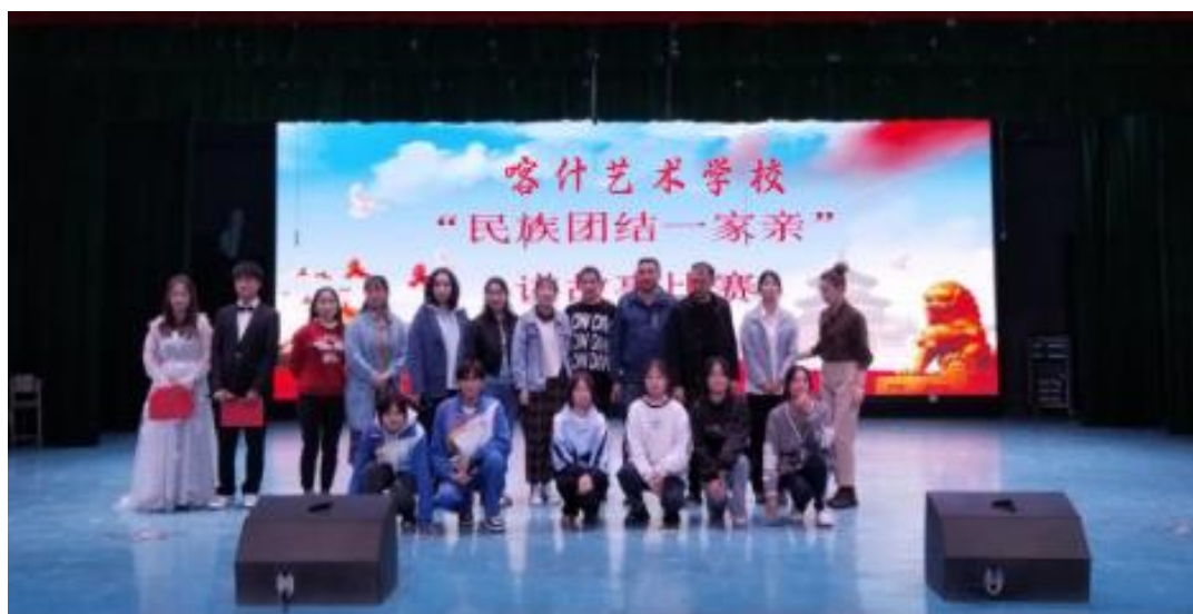
图2 民族团结一家亲

本次比赛吸引了来自各年级、各民族的众多参赛者，参赛选手们紧紧围绕主题，以饱满的热情，用生动、形象、富有感染力的语言，讲述了一系列具有民族特色的故事，表达了对党和国家的热爱之情，这些故事既展现了民族文化的独特魅力，又突显了民族团结的重要性。