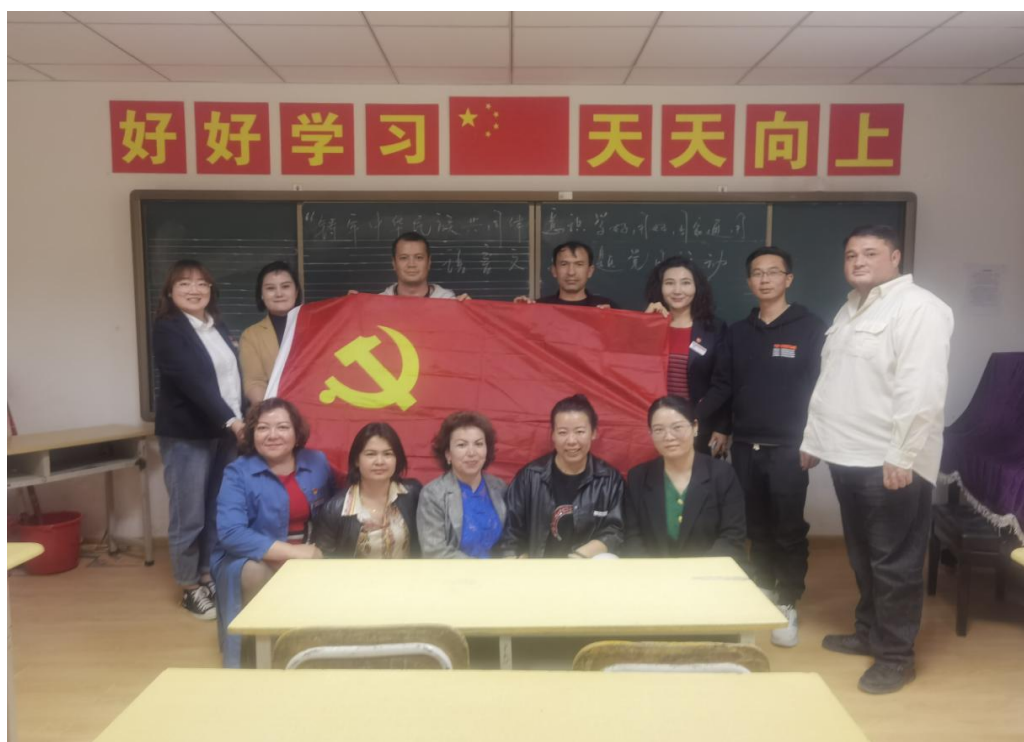
图 13：学好用好国家通用语言文字

此次主题党日活动，使教师们在轻松活泼的气氛中增强了团队意识，培养了协作精神，增强了教师们对中华民族文化的认同感。希望在日后能够凝心聚力，携手共进，在不断进步中书写祖国更加繁荣昌盛的未来！