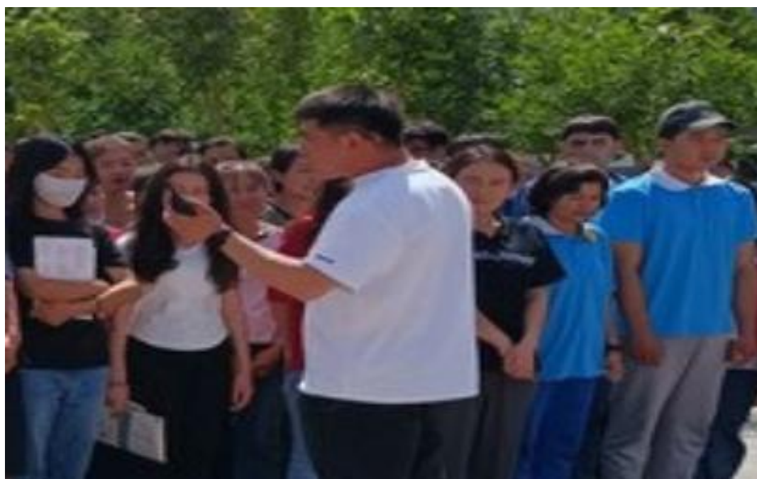
图 43：学生社区志愿宣讲

2023 年 4 月 26 日，喀什艺术学校利用周末组织学生开展了“三下乡”劳动教育，合理设置并细化每一个劳动岗位，制定明确岗位职责和标准，使每一个学生参与到劳动中来，与喀什市阳光社区党群服务中心联系，利用社区现有的资源，让学生深入社区参与劳动实践、志愿宣讲、垃圾分类等活动，收获社会责任感，提升小公民幸福感。