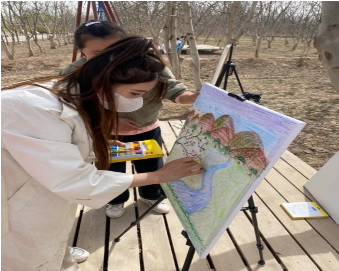
图 19：传承先烈遗志 守护健康成长

2023 年，学校进一步加大教学资源投入，各项办学指标更好地适应了学校改革发展需要和学生成长成才需求，办学实力不断增强。