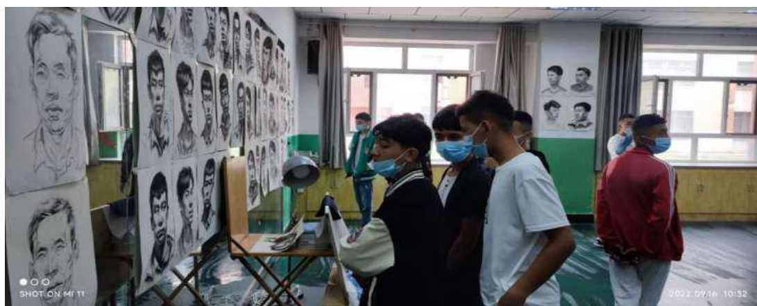
图 27：美术专业新生参观画室等场所

认识，明确在校期间的学习任务及能力发展方向。学校深入开展“三进两联一交友”活动，在部分班级开展“导师制”试点。导师利用自身的专业知识和社会阅历，针对每个学生自身的特点进行具体指导，通过与学生面对面互动式交流，实施“导学”“导做”和“导研”活动，对学生的发展方向提出具体建议，指导学生根据毕业后从事的专业岗位的技能要求作好学习计划，指导学生参与创新实践活动，训练学生发现问题、思考问题和解决问题的科学素养，提高学生发现问题、分析问题和解决问题的能力，增强学生的创新意识，督促学生在完成教学计划规定的学习任务的同时，结合自己的爱好和特长选好各类选修课程，拓展知识面，发展个性和特长，使学生的能力得到充分提高和发展，为学生个性发展和创造潜能的发挥提供条件。