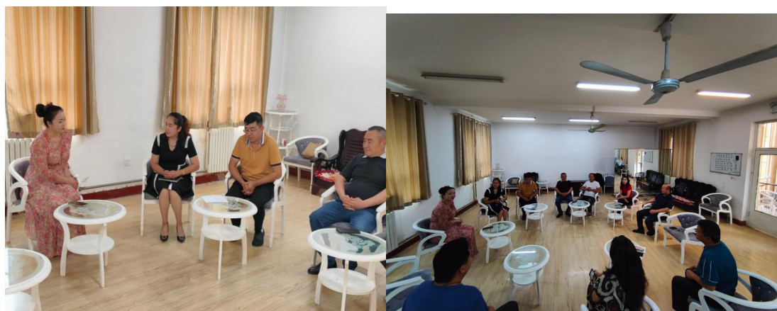
图 37：与企业一起对实习学生进行指导和管理

学校组织相关专业教师、企业专家、思政教师组建专业建设委员会，对行业状况、岗位需求开展调查，对学校教师团队建设、实验实训条件等进行考察分析，对标行业标准，设定人才培养目标，修定人才培养方案；在学生入校之初，让学生走进企业，开展专业认知，感受职业生活；应学校的请求，企业向派出专业技术人员参与课程的教学活动；学校派驻实习管理指导教师，与企业一起对实习学生进行专业指导和教育管理。