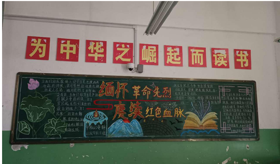
图 1 黑板报比赛

为丰富校园文化生活，调动学生学习的主动性、积极性和创造性，努力营造良好的班级学习氛围。结合校团委的规划与安排，进一步扎实落实开展校园文化建设，通过清明节，祭奠革命先烈，弘扬红色文化，组织开展黑板报评比活动。