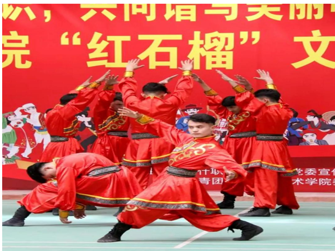
图 16：“红石榴”文艺展演活动

根据喀什地区教育系统新时代文明实践志愿服务活动的整体安排部署，紧密结合新形势、新任务，坚持求真务实，大力弘扬“奉献、友爱、互助、进步”的志愿服务精神，喀什艺术学校志愿服务队紧密结合志愿服务的实际与特点，于3月24日以“红石榴”文艺展演的形式举办了志愿服务活动。这次文艺展演不仅是一次单纯的展演，也是一次民族大团结的盛会，更是一次“民族团结，爱国爱党”的力量展示。学校充分发挥专业特色，通过组团式、专业化活动形式深入到广大师生当中，以群众喜闻乐见的形式，融思想性、艺术性和娱乐性为一体，活跃了校园文化氛围，丰富了师生文化生活，将文化润疆工程落到了实处。