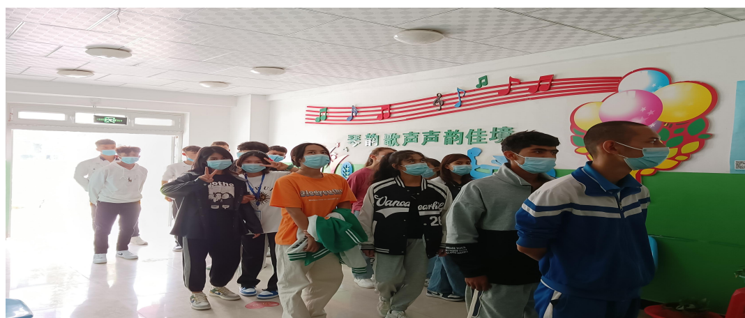
图 29：墙体的音乐标语

根据喀什艺术学校教务科的安排，音乐教研室教师带领2022级音乐专业班学生到音乐实训楼7号楼和5号楼以及国学院参观，让学生对专业有了新的认识。学生进入7号楼大门时首先看到墙体的音乐标语，使学生对音乐充满希望。