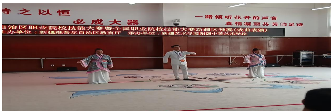
图 23：戏曲赛项学生组比赛现场

技能大赛不仅是切磋技能、相互交流、展示风采的舞台，更是充满竞争的技场。唯有勇于开拓、刻苦训练，练就一身精湛技能，才能实现造就高技能高素质人才的育人目标。