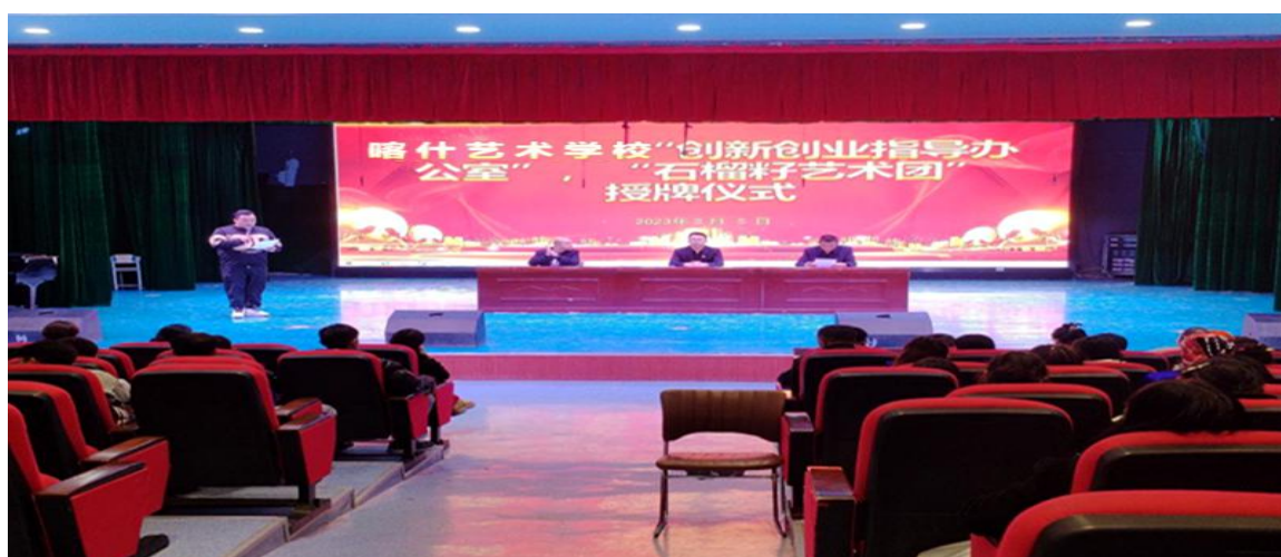
图 20：创新创业指导办公室、石榴籽艺术团授牌

喀什艺术学校将《学生创新创业》列为必修课全面开设，为切实提高学生创新精神、创业意识和创新创业能力，推动了创新创业教育与专业教育课程深度融合。激发了教师创新创业的热情。