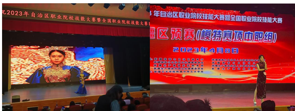
图 21：模特赛项教师与学生组比赛现场

此次比赛，音乐、舞蹈教研室共 8 名师生参赛，音乐教研室 1 名教师参加模特表演比赛、2 名教师参加声乐表演比赛、3 名学生参加戏曲表演比赛、舞蹈教研室 2 名学生参加模特表演比赛，教务科牵头统筹协调，筹备期间多次召开大赛推进会议，制定了详尽的工作方案。