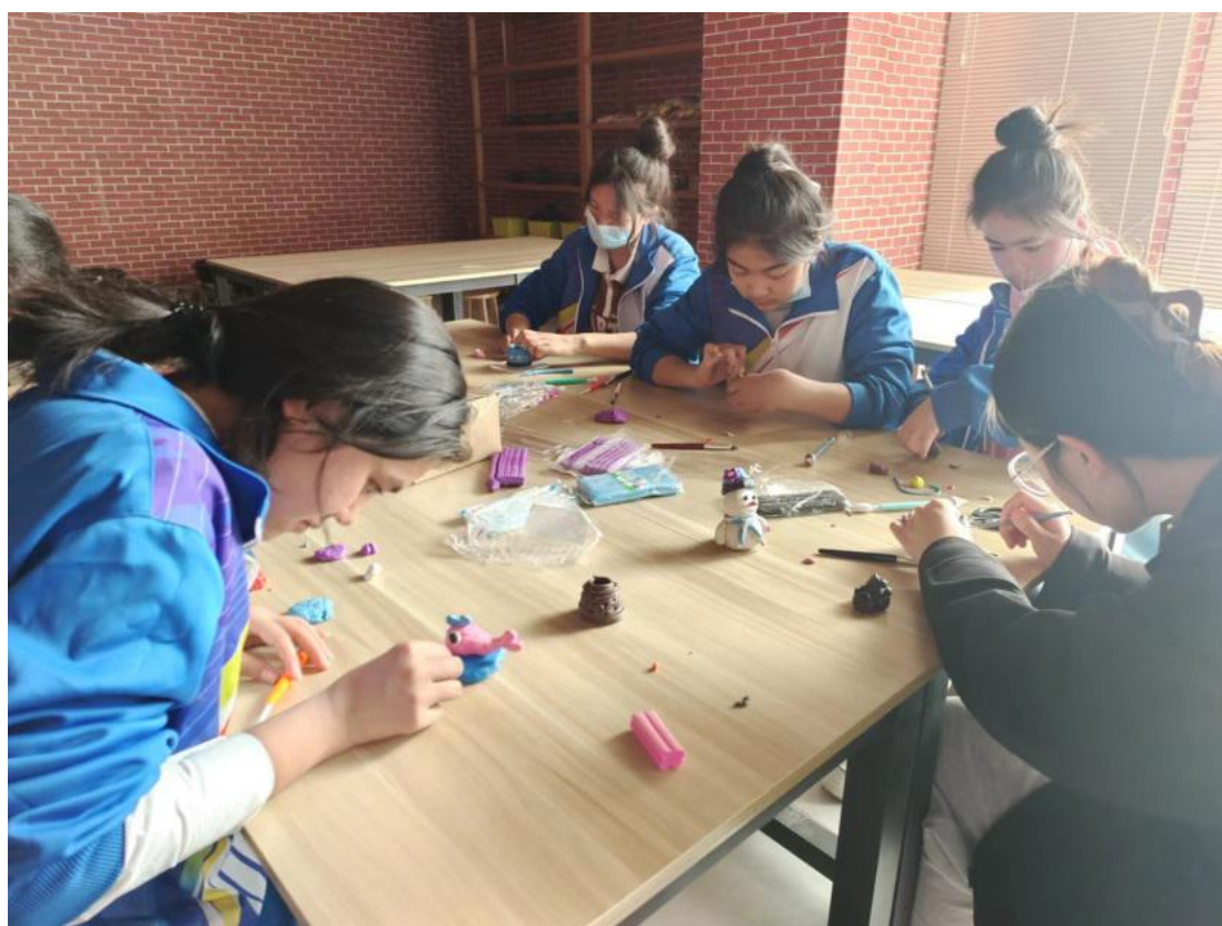
图 51：学生用陶泥创作

陶艺是集绘画、书法、雕塑、装饰、人文于一体的综合性艺术，经历了复杂而漫长的文化积淀过程。精美绝伦的陶艺作品不断启迪着学生们在学习和创作中感受美、理解美、鉴赏美和表现美。在陶艺坊里，有一群陶艺家，陶泥成为他们的玩具，一团团陶泥在他们手中变幻，生长成一件件陶艺作品。3月23日，陶艺社团第一次活动开始了。陶艺社团的艺术家们迫不及待地走进他们的艺术世界！在陶艺坊里，我们看到了陶艺家们认真又执着，从打开陶泥开始，就在脑海里构思着创作形态，先构思，再用手揉搓、按捏，擀等方法，慢慢地形成了一个又一个令人惊叹的形态。学生们在与陶泥的亲密接触中，感受到了中国传统技艺的乐趣，也体会了创造和想象的魅力，这一切的一切既是磨练，也是成长。