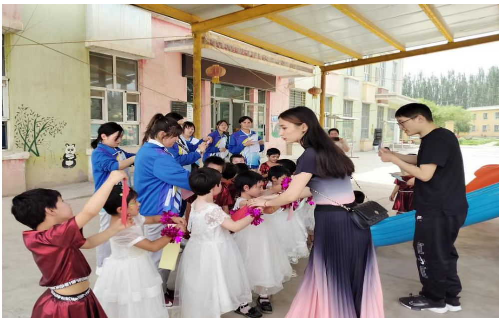
图 45：幼儿保育专业同学和小朋友做游戏