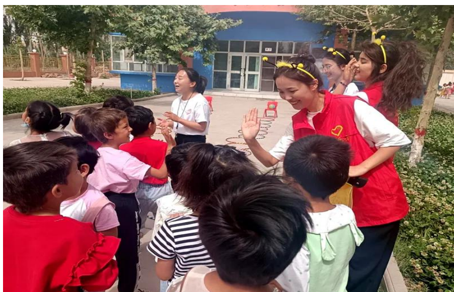
图 42：师生与幼儿园小朋友进行亲密交流

最后，根据幼儿园学习安排，学校学生参与到了其日常课外操、户外游戏的组织中，和小朋友们一起做跳皮筋、丢沙包等游戏，也让学校学生进一步了解幼儿园教学的日常形式，同时通过和幼儿园小朋友做游戏，提升组织能力和管理能力，提升责任心。