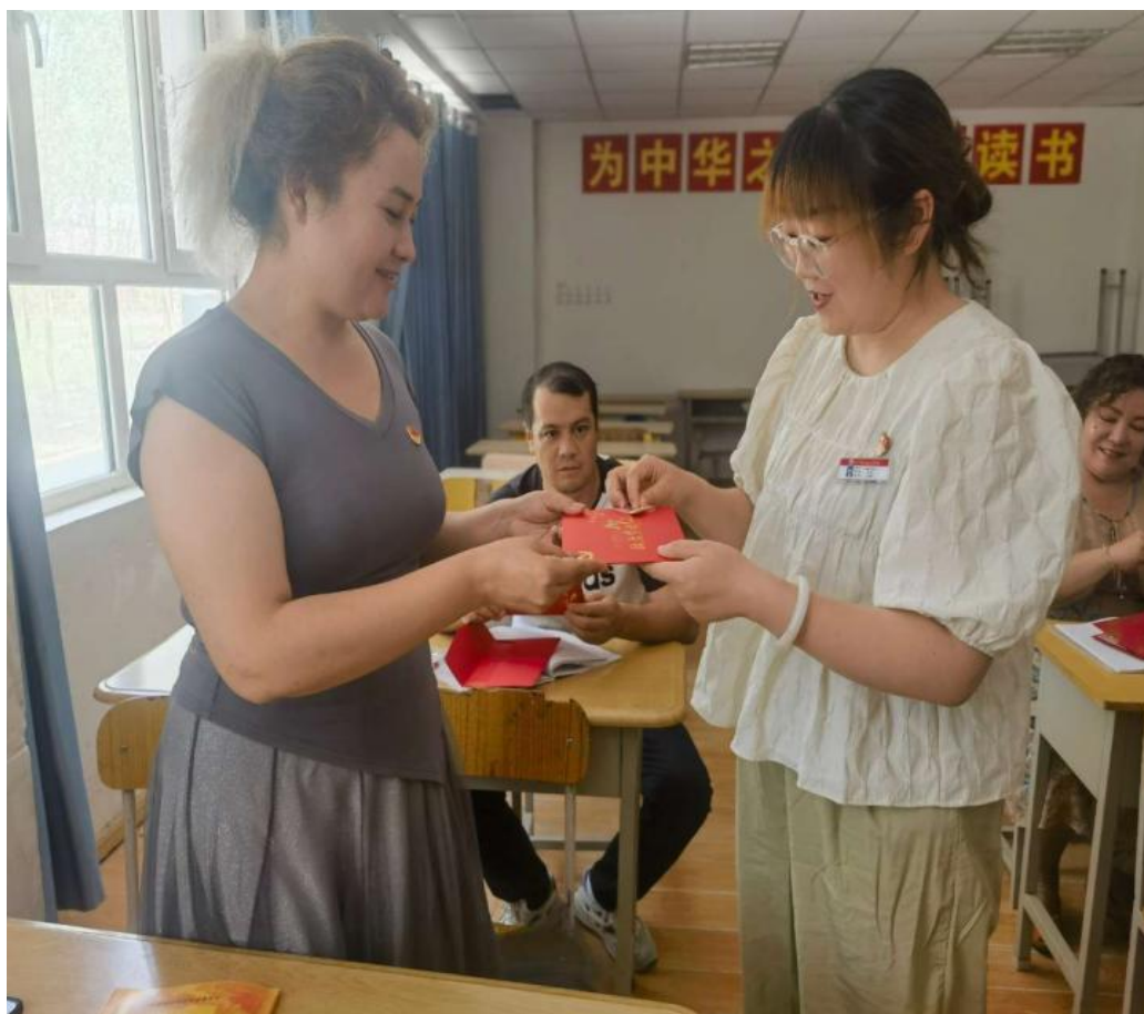
图 15：党员教师互赠政治生日卡与党徽

此次充满仪式感的“政治生日”，不仅进一步提高了党组织的凝聚力和战斗力，还使党员教师充分感受到了党组织的关心和关爱，增强了归宿感、荣誉感和使命感，必将引导广大党员同志怀揣入党初心、矢志勇毅前行！