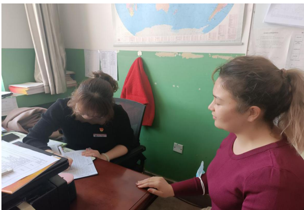
图 11：抽背学习党的二十大精神专题活动

今后，我们将以二十大精神专题诵读比赛、知识竞赛等各种形式持续深入学习贯彻党的二十大精神，坚持为党育人、为国育才，奋勇前进，为实现第二个百年奋斗目标，实现中华民族伟大复兴的中国梦不懈奋斗。